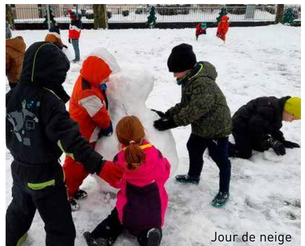
Jour de neige