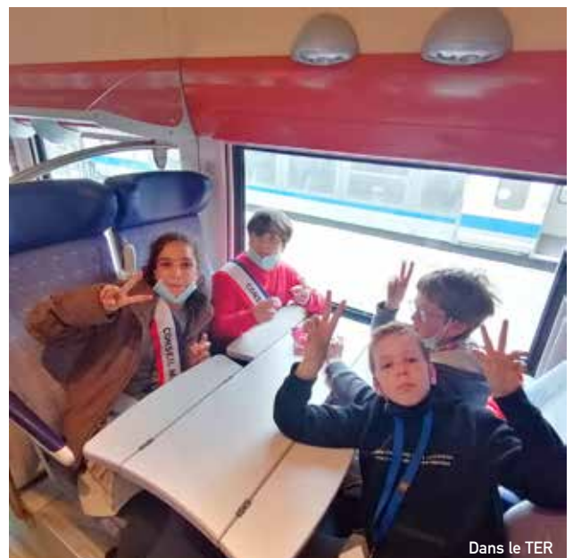
Dans le TER