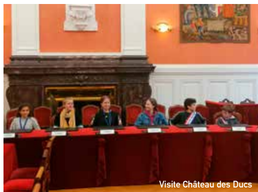
Visite Château des Ducs