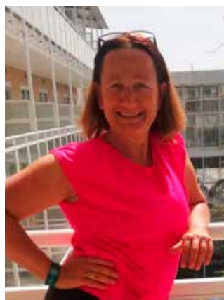
Manue DURIF L'église