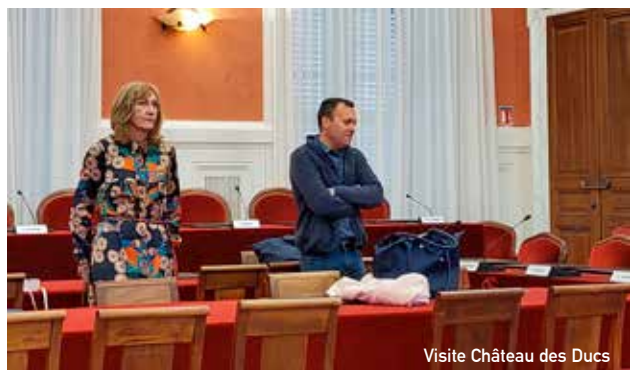
Visite Château des Ducs