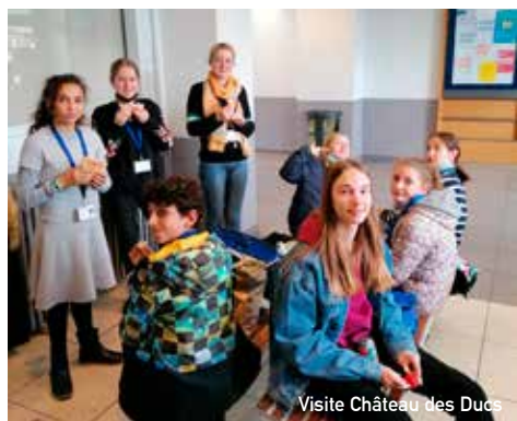
Visite Château des Ducs