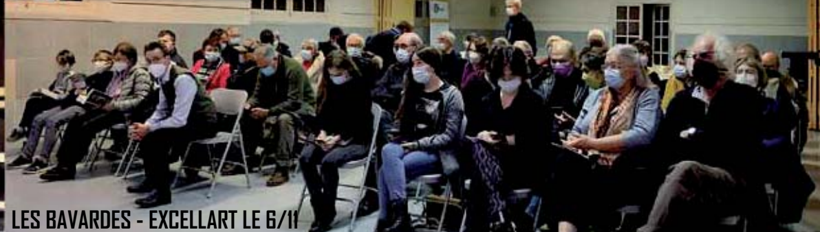
LES BAVARDES - EXCELLART LE 6/11