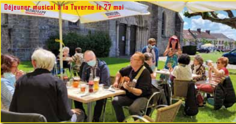
Déjeuner musical à la Taverne le 27 mai