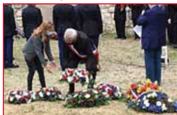
Cérémonie du 29 août à Villeneuve Saint-Denis.

Bien sûr, nos Jeunes Conseillers ont d'autres projets en cours. La collecte des bouchons continue. Vous pouvez toujours les déposer dans le carton à la Mairie.