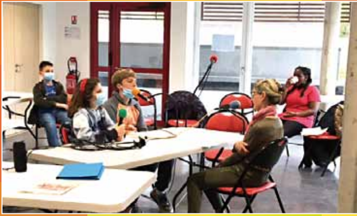
Le CCJ en plein travail avec FILE7