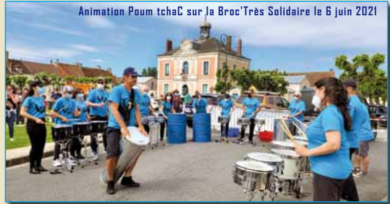
Animation Poum tchaC sur la Broc'Très Solidaire le 6 juin 2021