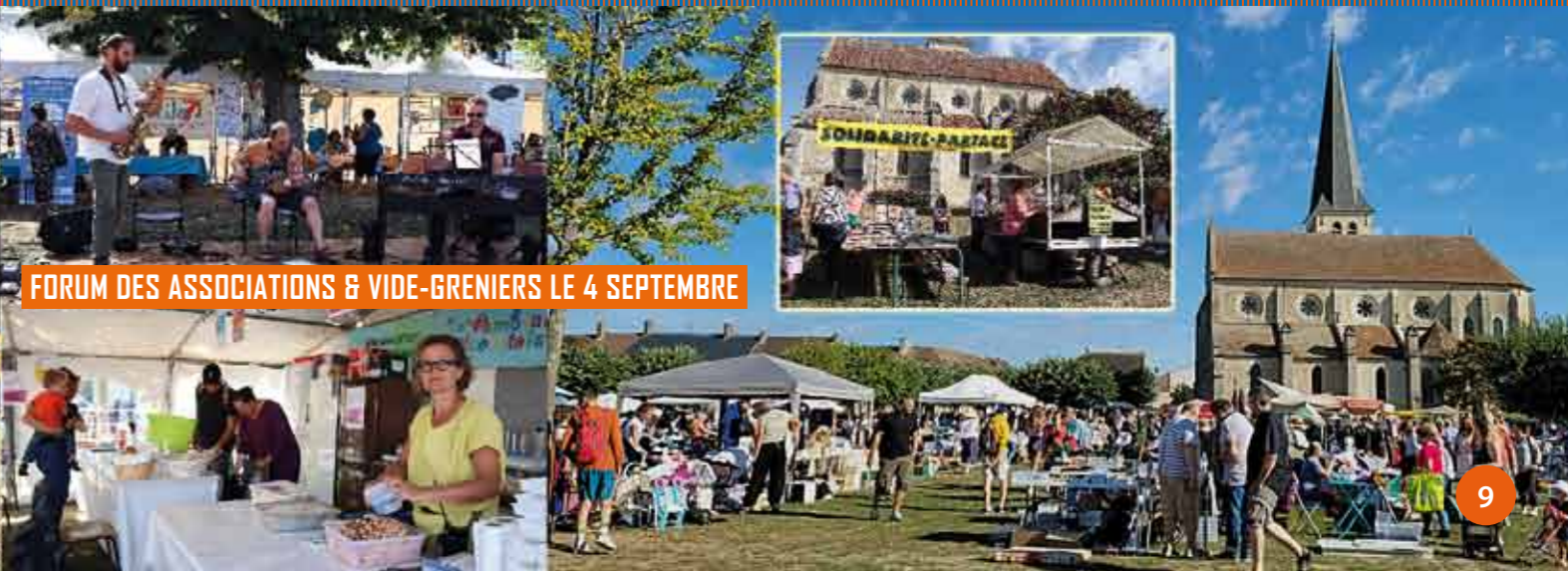
FORUM DES ASSOCIATIONS & VIDE-GRENIERS LE 4 SEPTEMBRE