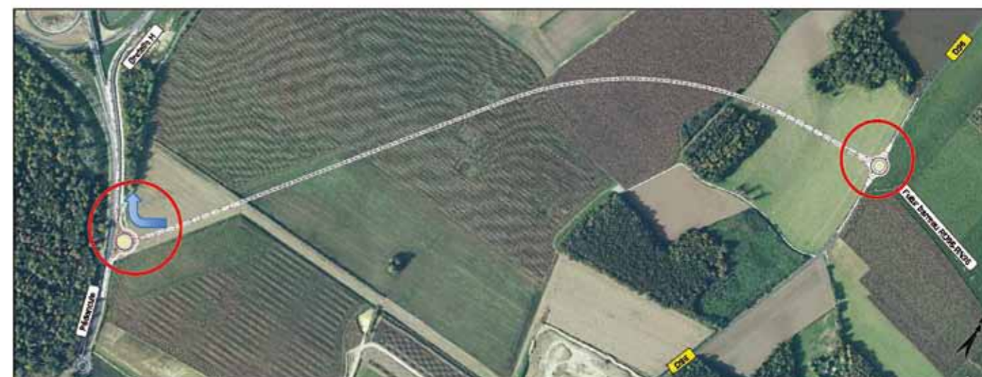
Synoptique du tracé