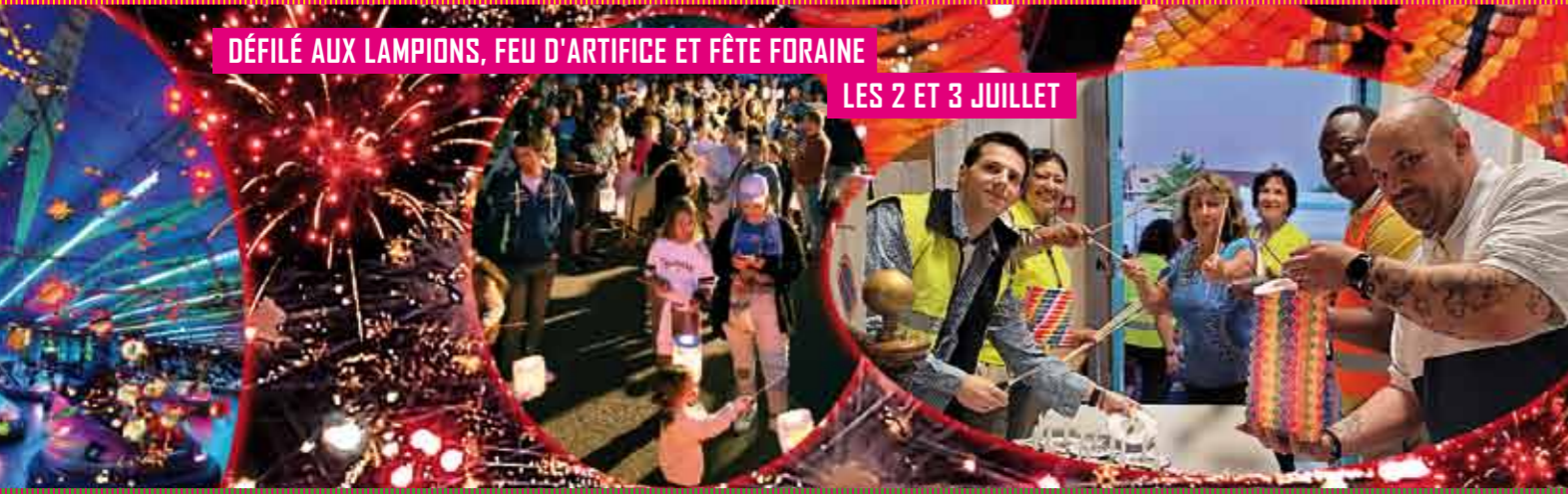
LES 2 ET 3 JUILLET