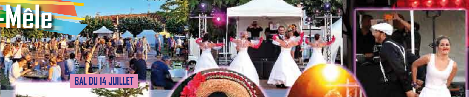
BAL DU 14 JUILLET