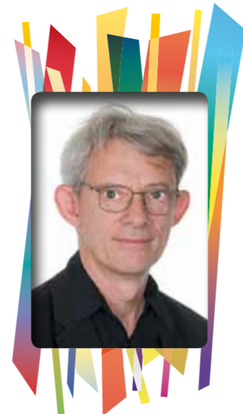
Villeneuve le Comte, Notre Village Bulletin Municipal N° 93