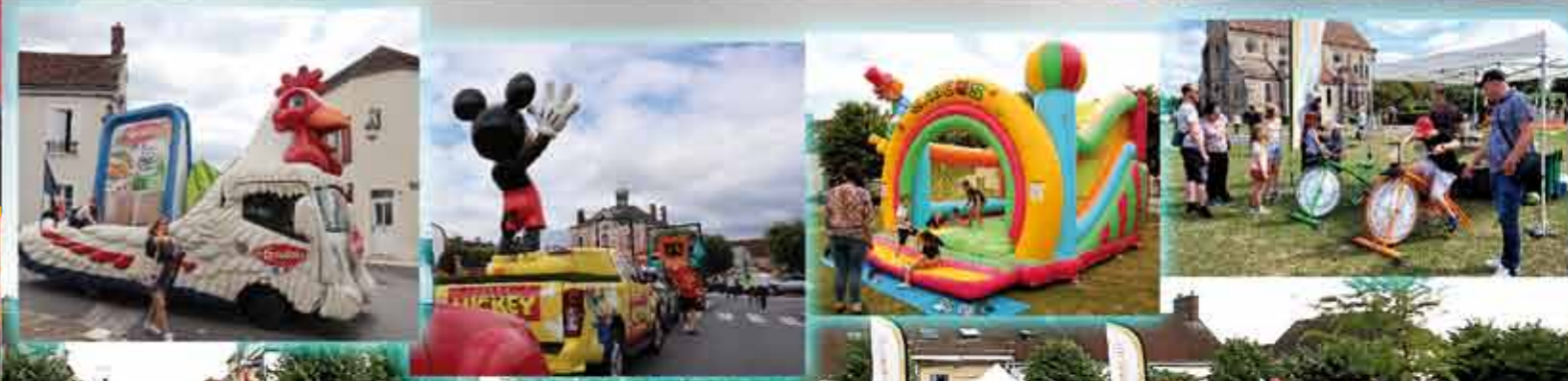
TOUR DE FRANCE FEMMES LE 25 JUILLET