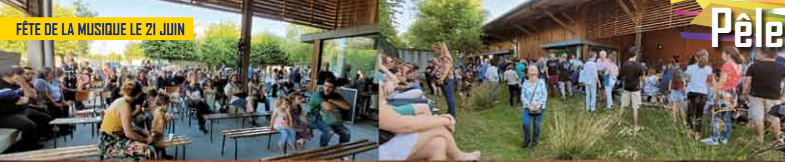
FÊTE DE LA MUSIQUE LE 21 JUIN