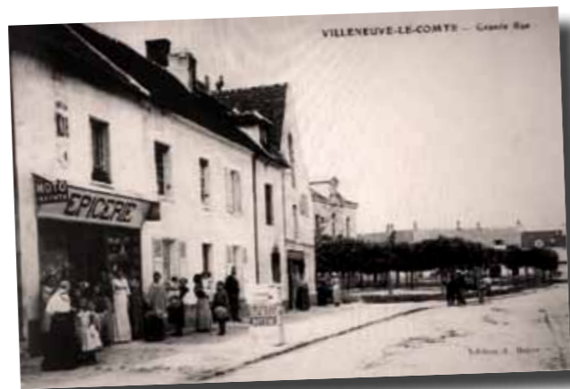
La première vraie pompe était installée rue de Paris dans le premier garage automobile là où se situe aujourd'hui notre carrosserie.