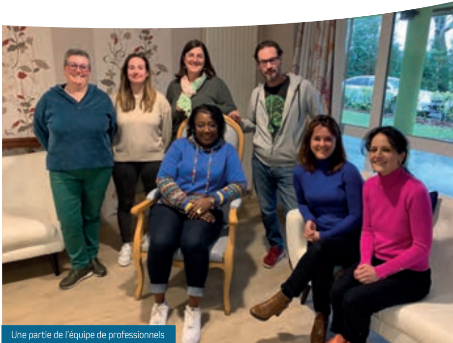
Une partie de l'équipe de professionnels