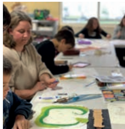
Les jeunes adhérents réalisent une affiche sur le thème d'Harry Potter

Contact : Liliane BOURNIGAL au 06.71.89.45.27 ou contactsa44@gmail44