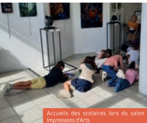
Accueils des scolaires lors du salon Impressions d'Arts