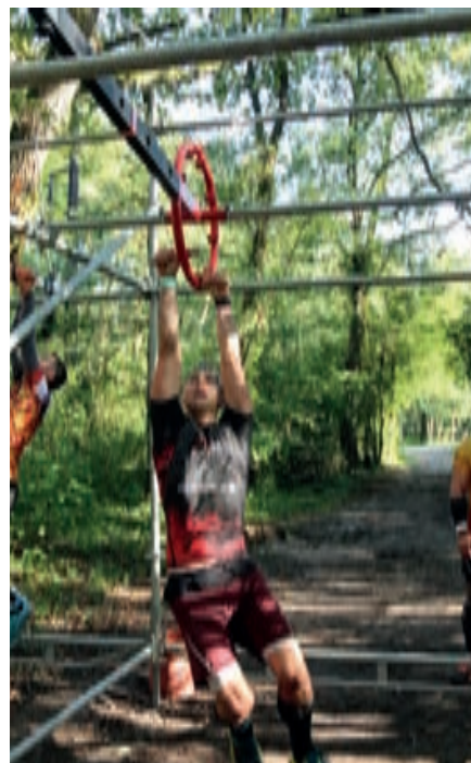
Une séance réalisée par OCR44