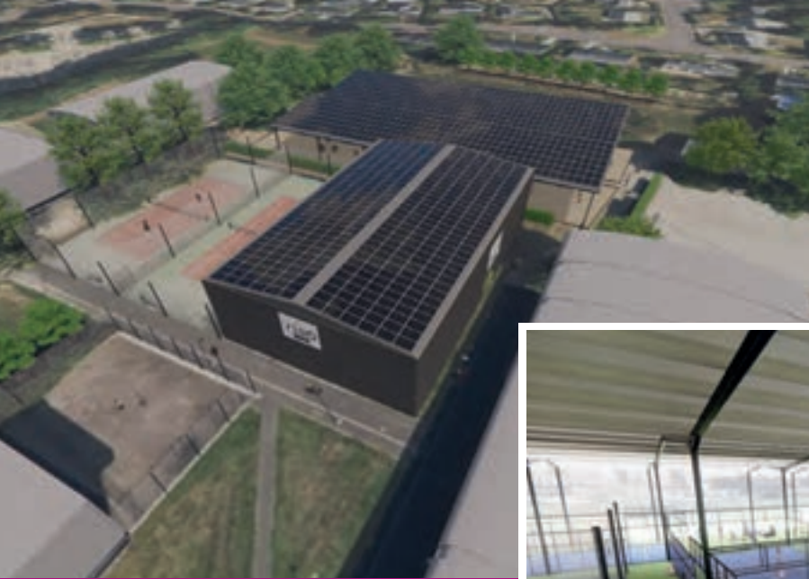
Simulation des terrains sur le complexe sportif