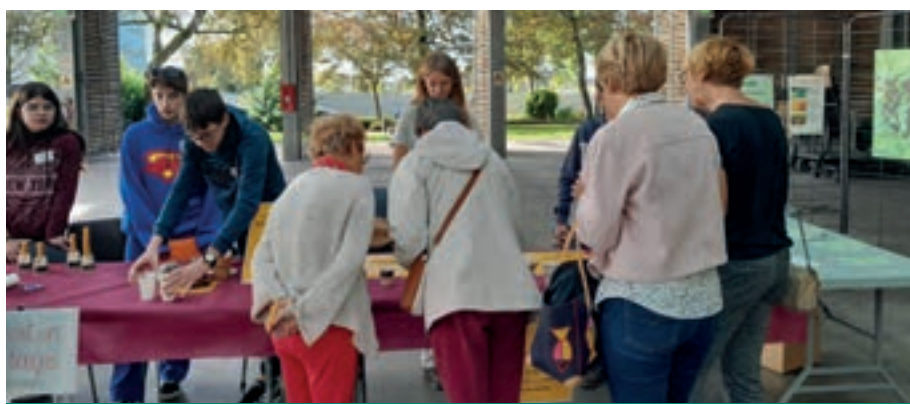
Les écoresponsables animant une dégustation de miel lors de la semaine du développement durable en octobre 2023

« Ce sont des élèves très engagés, qui ne se ménagent pas et qui ont à cœur de sensibiliser les gens à l'environnement de manière ludique. Leurs animations parlent à tout le monde. Ils étaient d'ailleurs fin février au Salon de