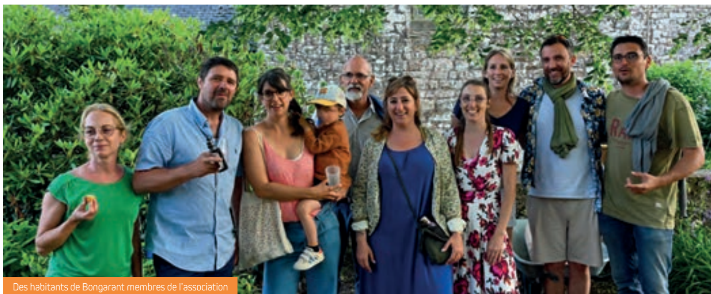
Des habitants de Bongarant membres de l'association

UNE NOUVELLE ASSOCIATION VIENT DE SE CRÉER À BONGARANT, LA BONG'ASSO, AVEC POUR OBJECTIF TISSER DES LIENS ENTRE LES HABITANTS ET PARTAGER L'HISTOIRE DE BONGARANT.