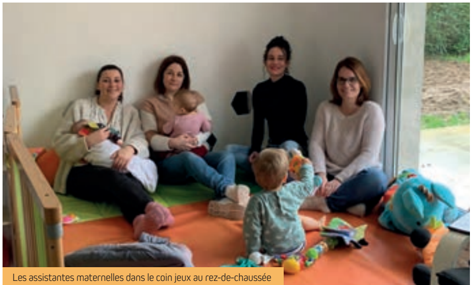
Les assistantes maternelles dans le coin jeux au rez-de-chaussée

En arrivant, une grande salle de jeux, lumineuse, s'ouvre directement sur le jardin,