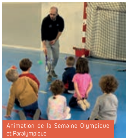
Animation de la Semaine Olympique et Paralympique

Tout comme la culture, le sport est un formidable vecteur de lien social. Au-delà de la dimension bien-être et santé, le sport véhicule des valeurs fondamentales de respect, de cohésion, d'esprit d'équipe.