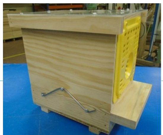
Piège nasse à grilles Néoppi jaunes