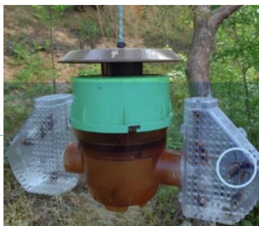
Piège coréen à ailes