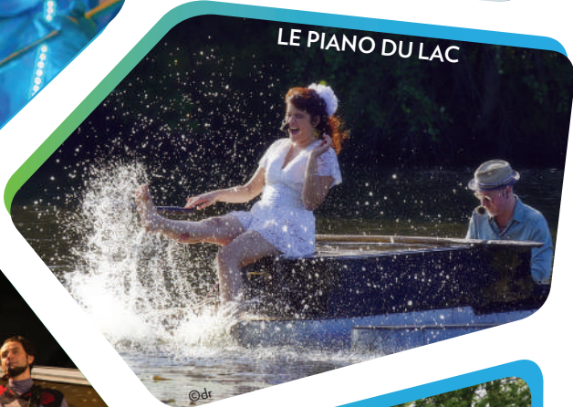
LE PIANO DU LAC