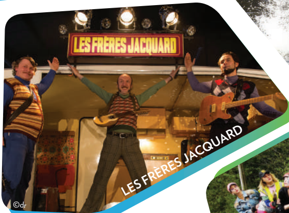
LES FRÈRES JACQUARD