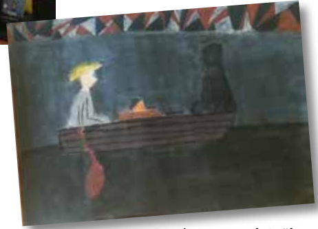
Dessin gagnant de Laëlya