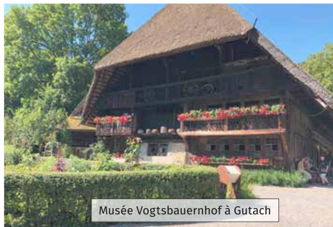
Musée Vogtsbauernhof à Gutach