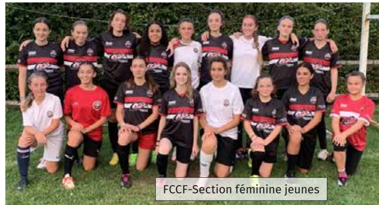
FCCF-Section féminine jeunes

Coté séniors, comme 9 autres clubs corréziens seulement, le FCCF arrive toujours à conserver ses 3 équipes masculines avec un effectif principalement composé de jeunes joueurs tandis que l'équipe