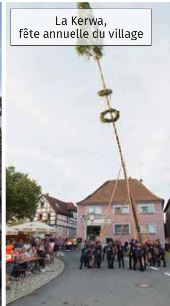
La Kerwa, fête annuelle du village