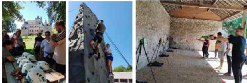
Rentrée 2023. 2 journées d'intégration au Château de Sédières.