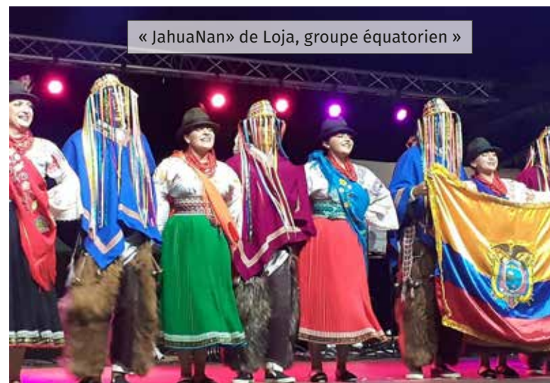
« JahuaNan » de Loja, groupe équatorien »

des groupes français et internationaux. Comme lors des 40 ans, il y aura également un festival enfants. Le groupe recherche pour son Festi'folk ou d'autres manifestations des bénévoles, le temps de quelques heures... Si cela vous dit de passer un bon moment, voir les coulisses, n'hésitez pas à prendre contact au 06 31 24 47 26 .