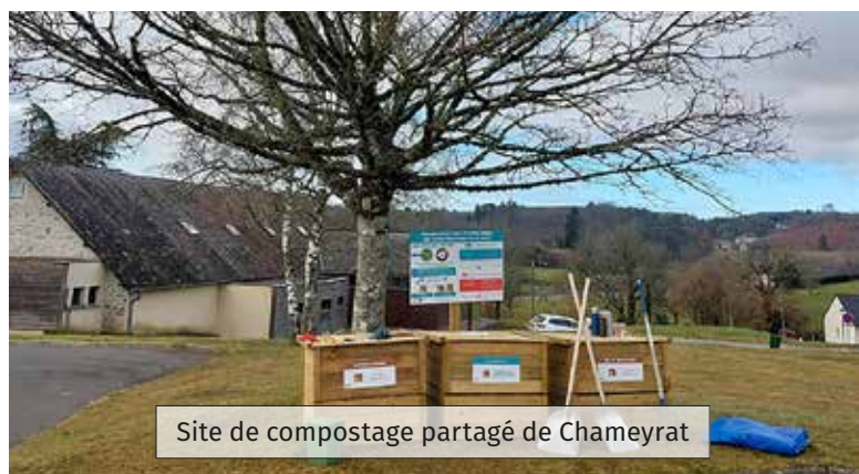
Site de compostage partagé de Chameyrat

Notre commune s'est portée volontaire pour l'installation d'un site de compostage partagé à proximité de l'école maternelle (cf. photo de Chameyrat). Ce type de site permet de créer plus rapidement