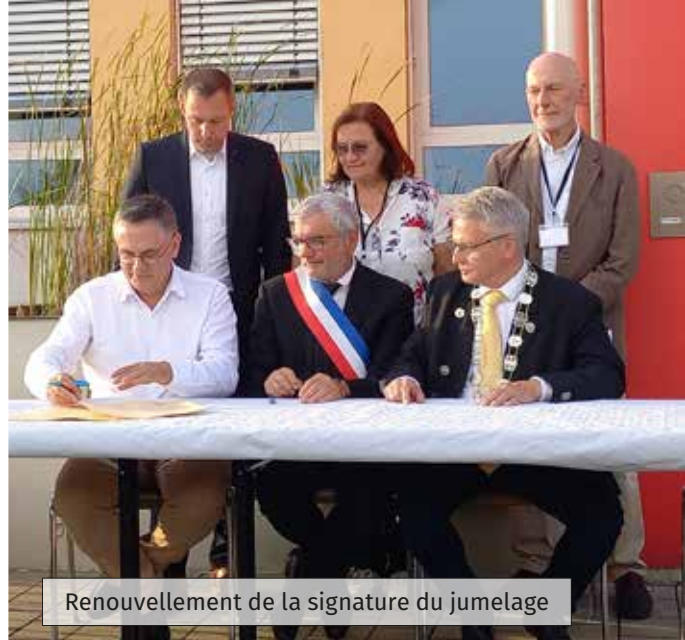
Renouvellement de la signature du jumelage

L'assemblée générale du Comité de jumelage a eu lieu le jeudi 23 novembre 2023 à la mairie de Cornil.