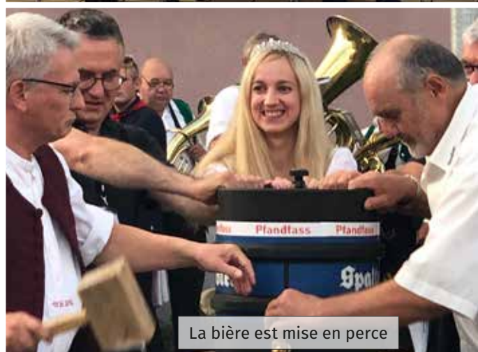
La bière est mise en perce