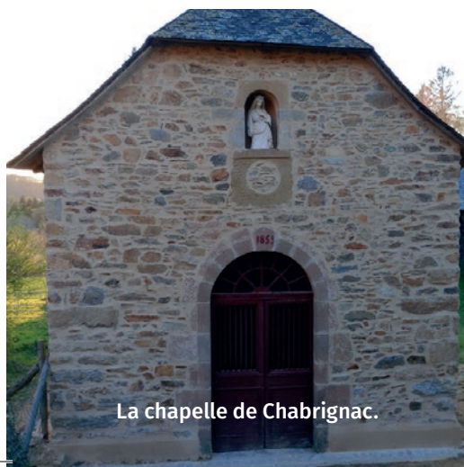
La chapelle de Chabrignac.

À l'école, l'avancement des travaux se poursuit sans encombre. Le préau et le dortoir devraient être opérationnels à la rentrée de septembre.