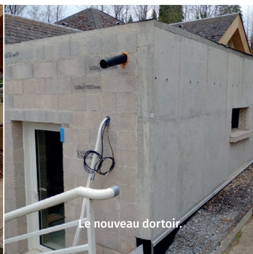
Le nouveau dortoir.