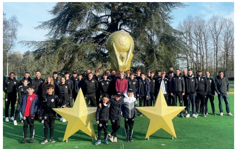
Les U17 et les éducateurs à Clairfontaine

Au niveau des animations, la fin de saison s'annonce bien remplie. Le club organisera deux tournois : un tournoi jeunes le jeudi de l'Ascension et un tournoi de sixte le 24 juin. Sans oublier le traditionnel repas Bodega le 10 juin à Sainte-Fortunade.