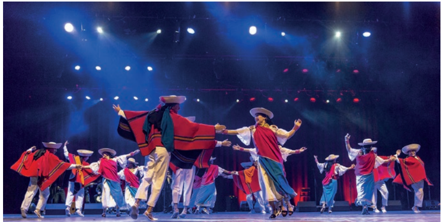
Le groupe équatorien « JahuaÑan » de Loja.

Pour le Festi folk' 2023, après la venue l'année dernière de la «Compañia artistica» de Cali en Colombie, nous recevrons cet été, le samedi 12 août, 2 nouveaux ensembles : un français et un international. Ce sera l'Équateur, avec le groupe « JahuaÑan » de Loja. « JahuaÑan » signifie en langue Quicha « chemin d'en haut ». Ce groupe, fondé en 1986, est le premier groupe artistique de l'Université Technique Particulier de Loja (UTPL) dans le sud de l'Équateur à la frontière péruvienne. Il s'est fixé pour mission de représenter la culture de Loja mais également équatorienne au niveau international. Grâce à l'appui financier de leur université, le groupe dispose d'un large panel de costumes représentant les différentes régions de ce pays andin. Il a un répertoire très fourni avec les régions de Saraguro, Loja, Cuenca, Cañari, Cochasqui, Cayambis, Otavalo, Valle delChota, Esmeraldasentre et autres. De plus il propose des danses nationales valorisant le métissage présent également dans le folklore équatorien. Le groupe JahuaÑan a travaillé