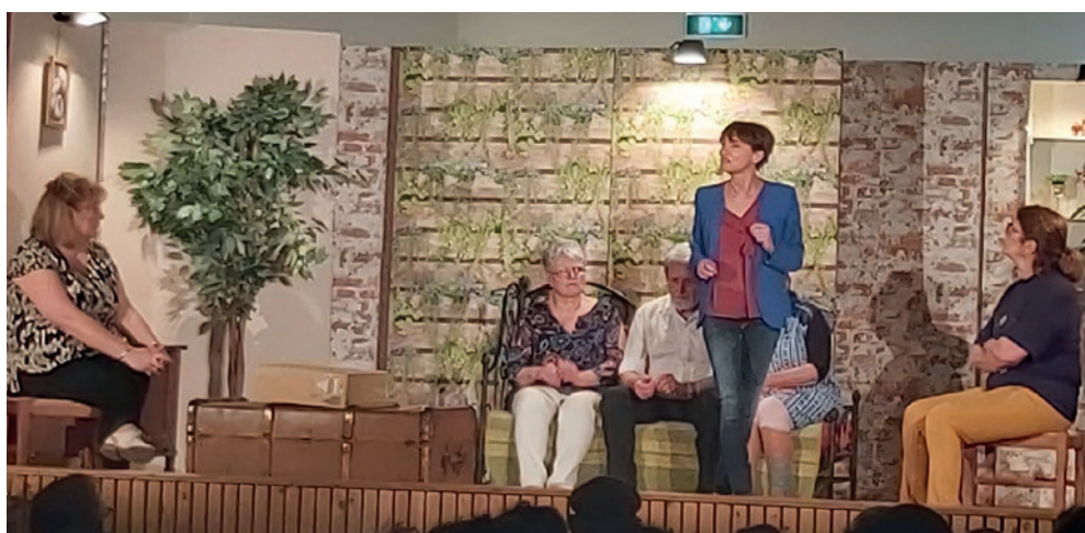
Les Songes Malices avec la pièce « Alors on Danse ».

Le 17 juin , fête du Foyer Rural avec un repas animé par les Guinches Pépettes, et dans l'après-midi, participation des sections du Foyer (danses, gym, expos...).