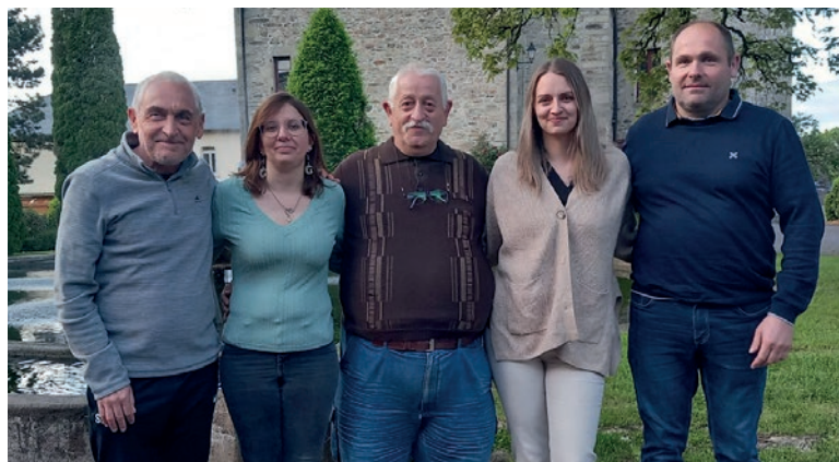
Les membres du nouveau bureau. Sébastien Gorlia, trésorier, absent sur la photo