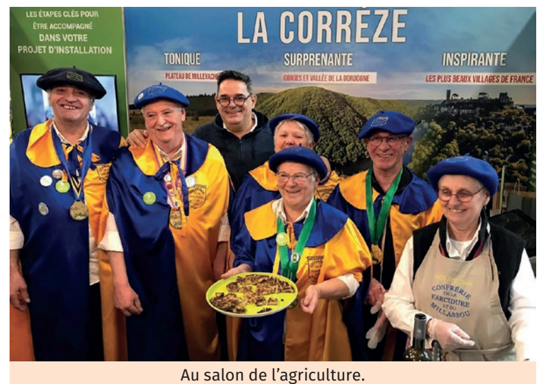
Au salon de l'agriculture.

La liste des sorties est encore longue pour les mois à venir, mais les consœurs et confrères sont prêts de même que le stock de pommes de terre !