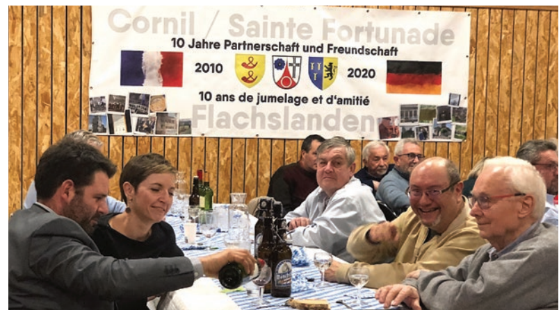
Repas d'anniversaire du Jumelage

Notre association de jumelage participera également au forum des associations le 9 septembre et nous serions heureux d'accueillir de nombreux habitants de Sainte-Fortunade sur notre stand.