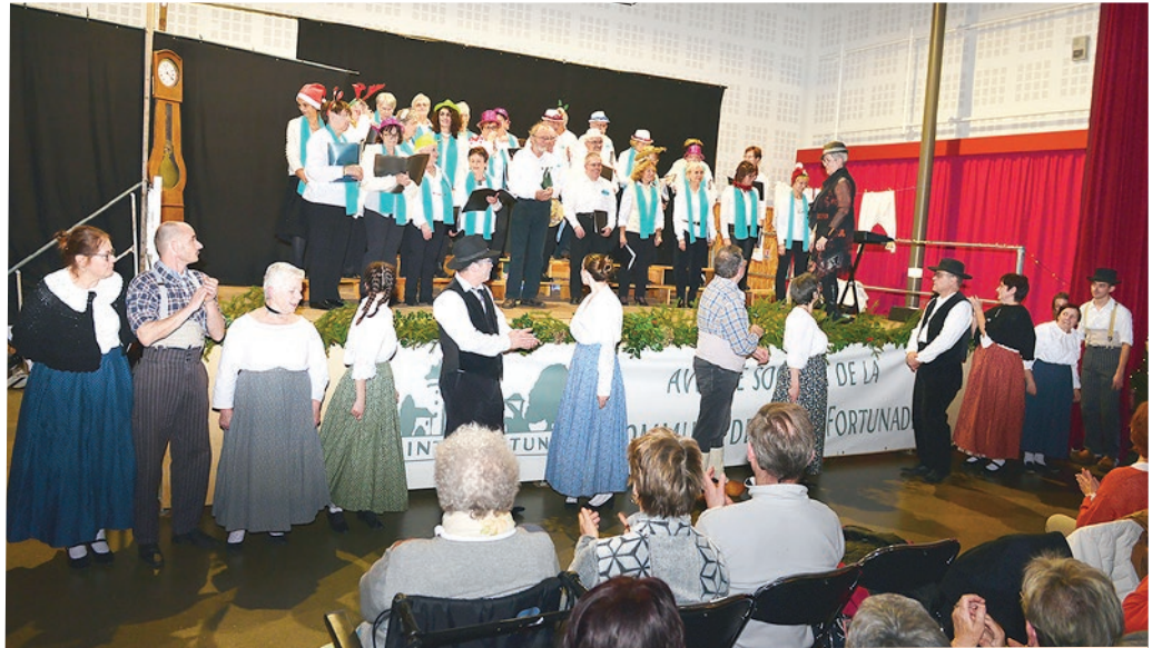
Veillée de Noël avec les Réveillés

Le dimanche 3 décembre, un concert sera donné dans l'église de Sainte-Fortunade, il sera alors temps de mettre en œuvre le programme pour 2024 ... une autre partition que la quarantaine de choristes préparent déjà pour que vive et chante Cantarella !!