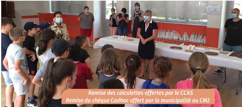
Remise des calculettes offertes par le CCAS Remise du chèque Cdhoc offert par la municipalité au CM2

La rentrée de septembre 2020 comptera 149 élèves (déficit de 9 enfants). La directrice M me Chambaudie et la Mairie prendront les inscriptions restantes durant l'été de même que les pré-inscriptions pour janvier 2021 des enfants nés en 2018.