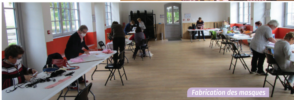
Fabrication des masques