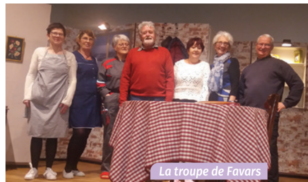
La troupe de Favars

Danses Populaires : 10 septembre ; Patchwork : 12 septembre ; Patois : 2 octobre ; Informatique : 15 septembre. Pour cette section le Foyer recherche une deuxième personne pour secondar Française.