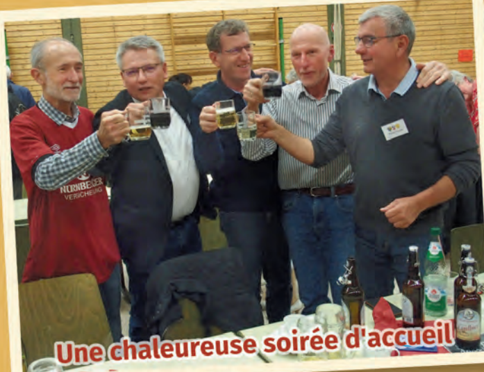
Une chaleureuse soirée d'accueil