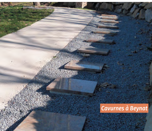
Cavurnes à Beynat