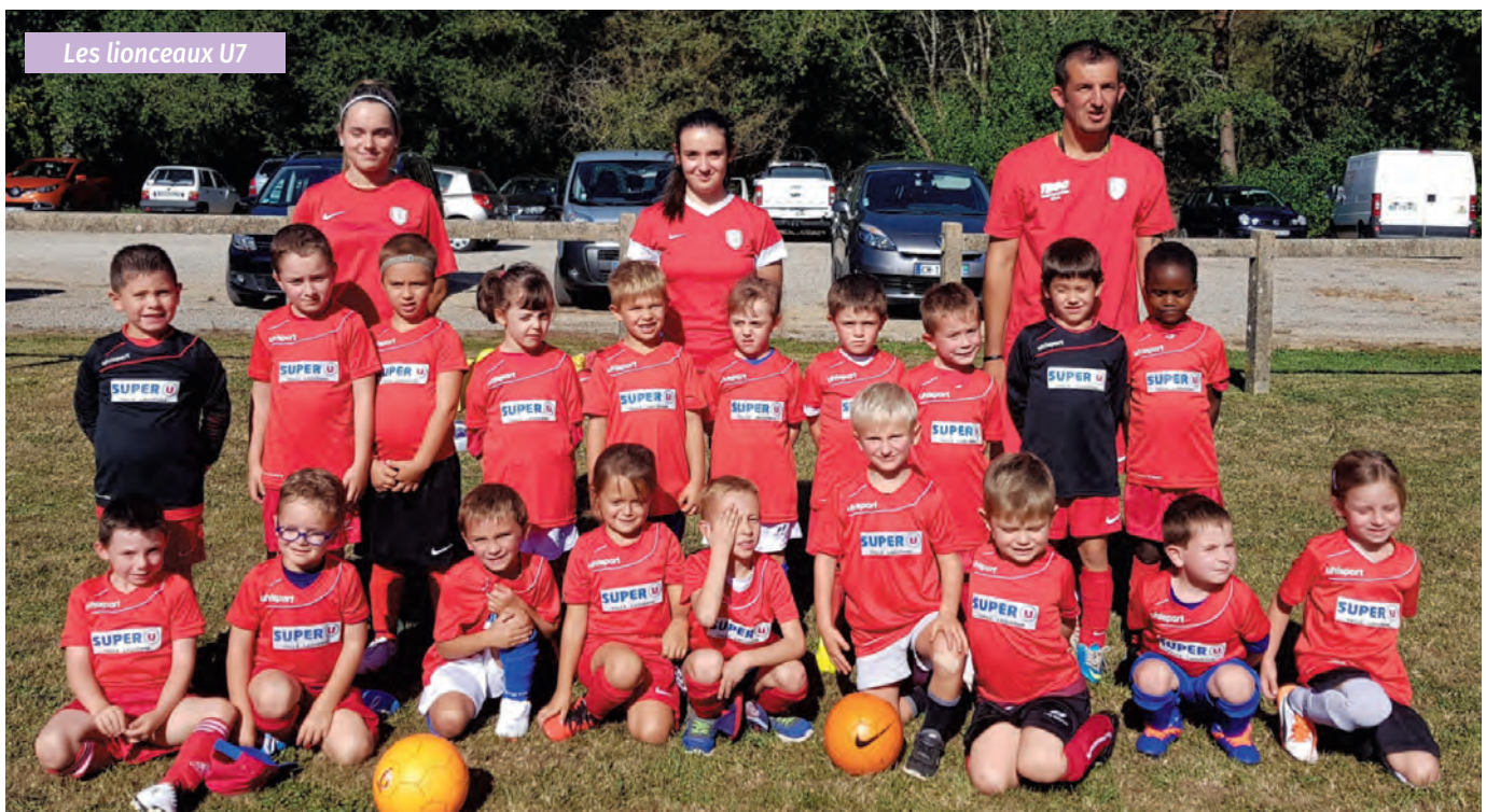
Les lionceaux U7

Dimanche 2 juin : Assemblée Générale, samedi 22 juin : Bodega-soirée Fortunadaise, puis participation aux Marchés de Producteurs de Pays en juillet et août.