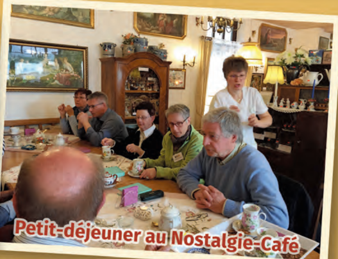
Petit-déjeuner au Nostalgie-Café