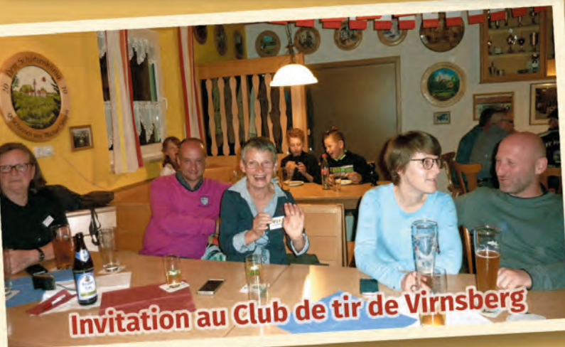
Invitation au Club de tir de Virnsberg