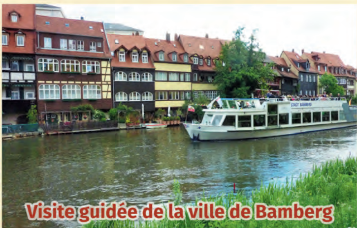
Visite guidée de la ville de Bamberg