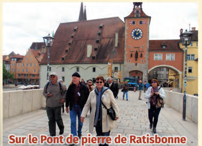
Sur le Pont de pierre de Ratisbonne