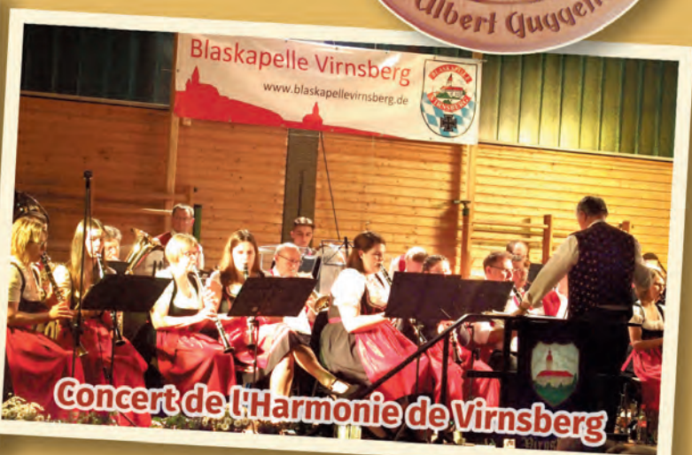
Concert de l'Harmonie de Virnsberg