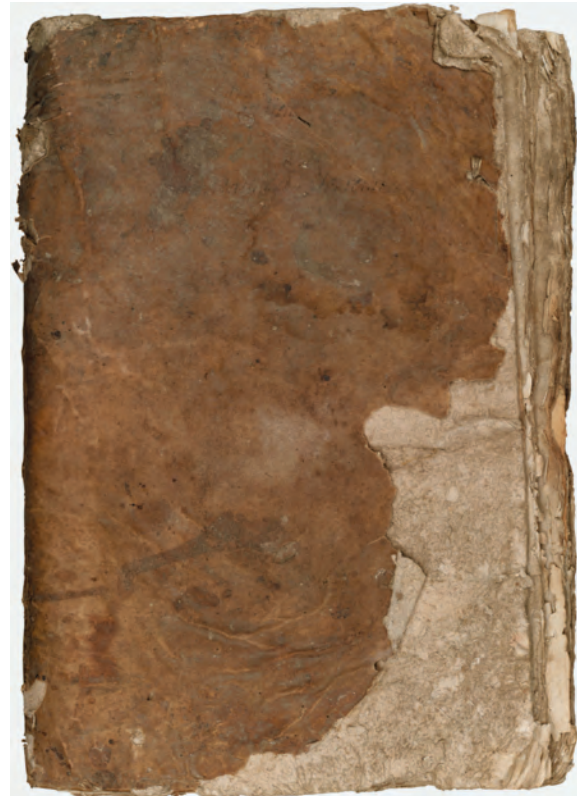
▲ Couverture État des fonds.

L'original sera prochainement remis officiellement aux Archives Départementales pour y être enregistré, conservé et mis à la disposition des chercheurs.