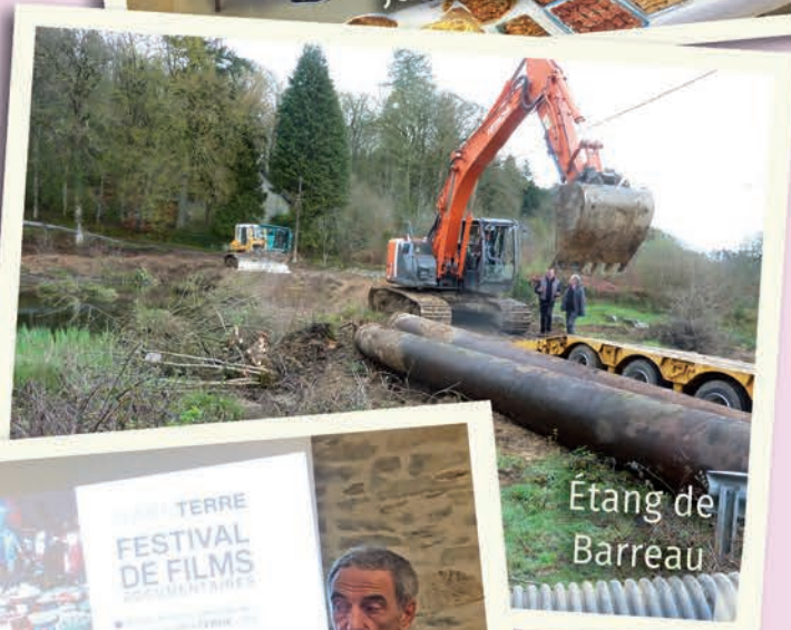
Étang de Barreau