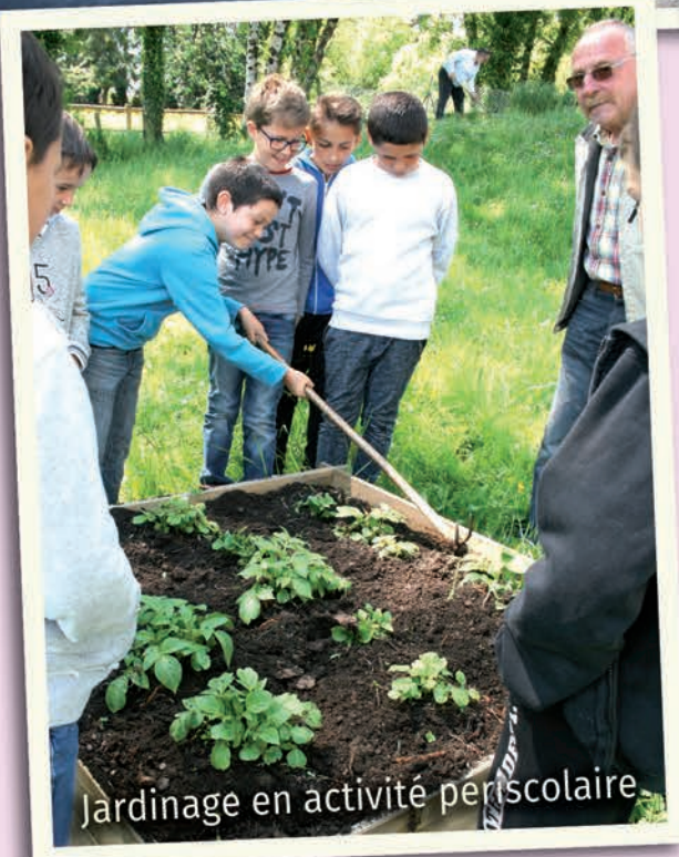
Jardinage en activité périscolaire