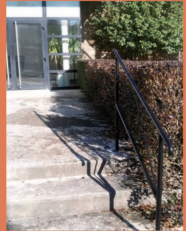
Rambarde à l'entrée de la salle polyvalente.

Conformément à l'agenda de mise en accessibilité des bâtiments communaux pour les personnes à mobilité réduite, des travaux de pose de rambarde ont été effectués à la salle polyvalente et au foyer rural.