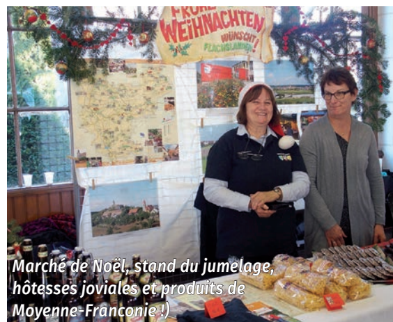
Marché de Noël, stand du jumelage, hôtesse joviales et produits de Moyenne-Franconie !

Et puis réservez le premier week-end d'octobre - Fête de la bière - pour