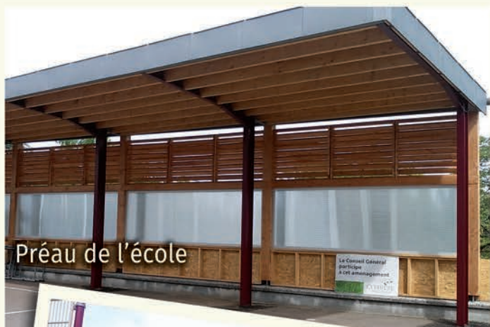
Préau de l'école