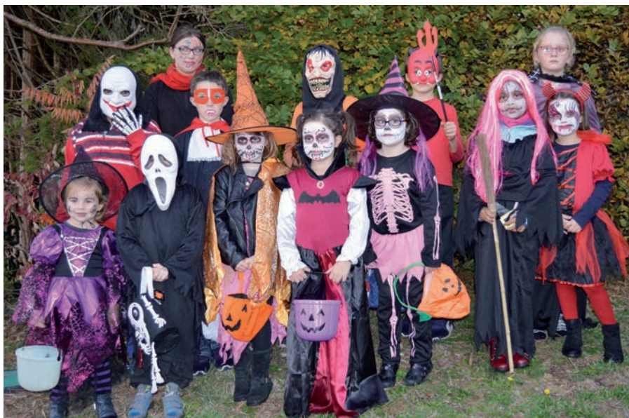
Soirée d'outre-tombe à Mialet !

Après un périple de quatre kilomètres, ils sont tous revenus avec leur marmite remplie de bonbons.