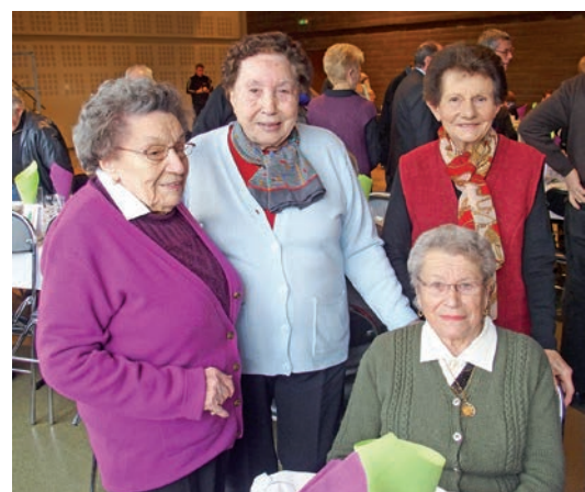
Des Aînées heureuses au repas du CCAS.

L'assemblée générale a eu lieu le dimanche 22 janvier et un repas farcidures aura lieu le dimanche 19 mars 2017.