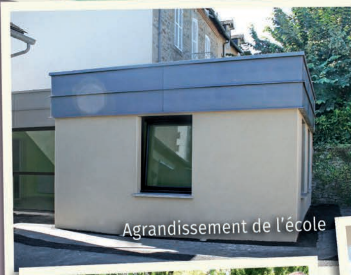
Agrandissement de l'école