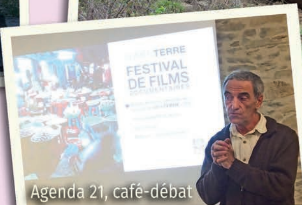
Agenda 21, café-débat