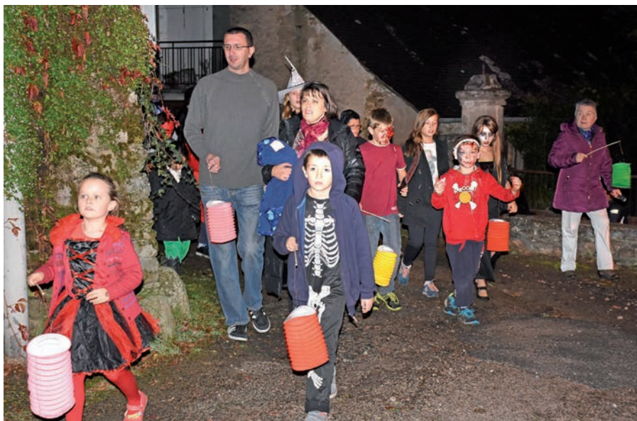
Halloween, retraite aux flambeaux dans le bourg.

Vampires, sorcières, fantômes, diables ont marché à la lumière des flambeaux, en découvrant le centre bourg à la tombée de la nuit. Petits et grands ont apprécié cette manifestation qui s'est terminée par un verre de l'amitié à l'orangerie. Rendez-vous l'an prochain pour une nouvelle nuit pleine de frissons !