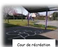
Cour de récréation