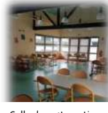
Salle de restauration