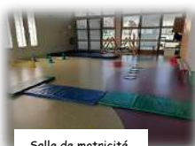
Salle de motricité

Tout au long de la journée, les élèves alternent différentes activités dans la classe. Ils profitent de locaux adaptés à leur taille.