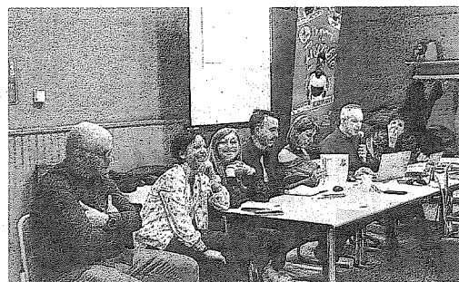
Les membres du TGV54 se sont réunis en assemblée générale.

bilan financier est équilibré. Parmi les nouveautés, notons le label 2 étoiles accordé au club pour son dynamisme. Celui-ci propose en effet des compétitions régionales et des formations qualifiantes aux entraîneurs. Un stage en Espagne est prévu en avril. Les personnalités officielles ont félicité le TGV54 pour sa progression et souligné l'importance des associations sportives pour dynamiser la région.