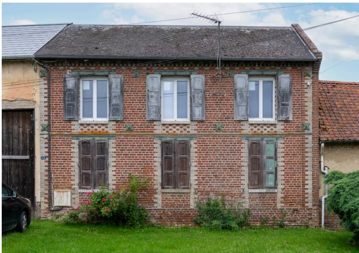
Logis de ferme, 1er quart 20e siècle, n°42 rue Principale, vue depuis l'est.