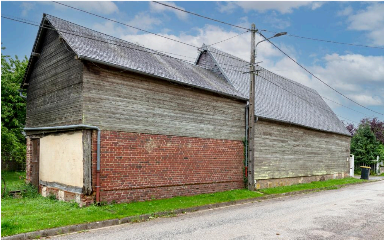
Bâtiments agricoles essentés en clins de bois, n°5 rue de Doméliers, vue depuis le nord-est.