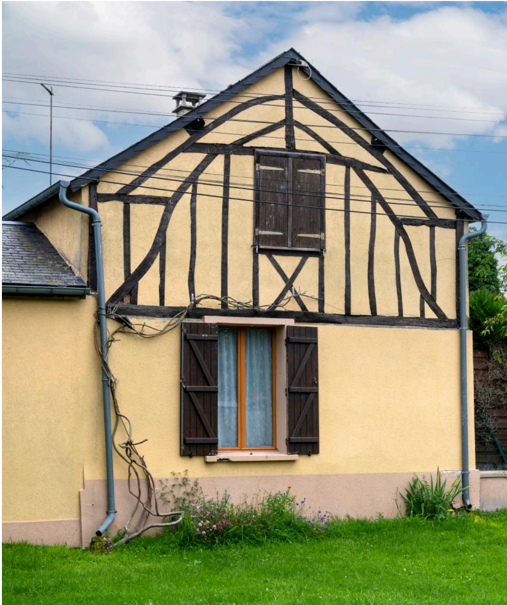
Pignon avec pans de bois apparents au n°52 rue Principale, vue depuis l'est.