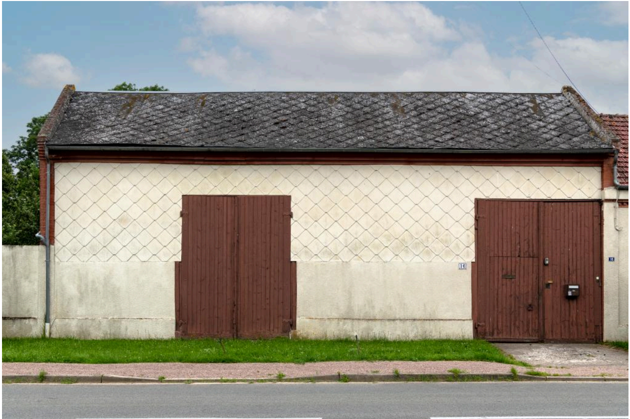
Ancienne grange n°16 rue Principale, vue depuis l'est.