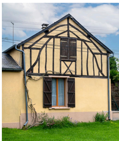
Pignon avec pans de bois apparents au n°52 rue Principale, vue depuis l'est.