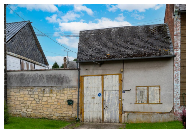
Entrée charretière avec fenêtres à engranger ou fenêtres d'atelier, n°27 rue Principale, vue depuis l'ouest. Le mur à gauche pourrait matérialiser l'ancien emplacement d'une autre grange.