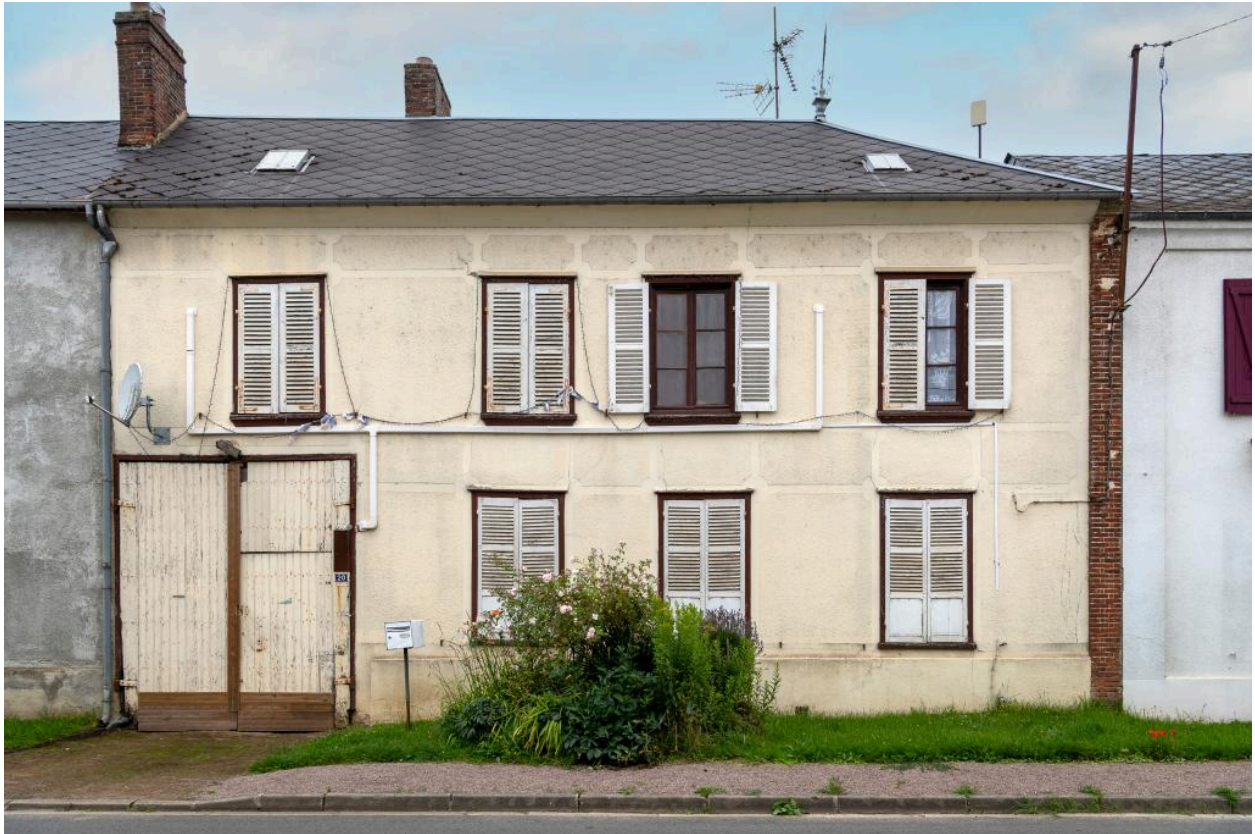
Ancienne boulangerie, n°20 rue Principale, vue depuis l'est.