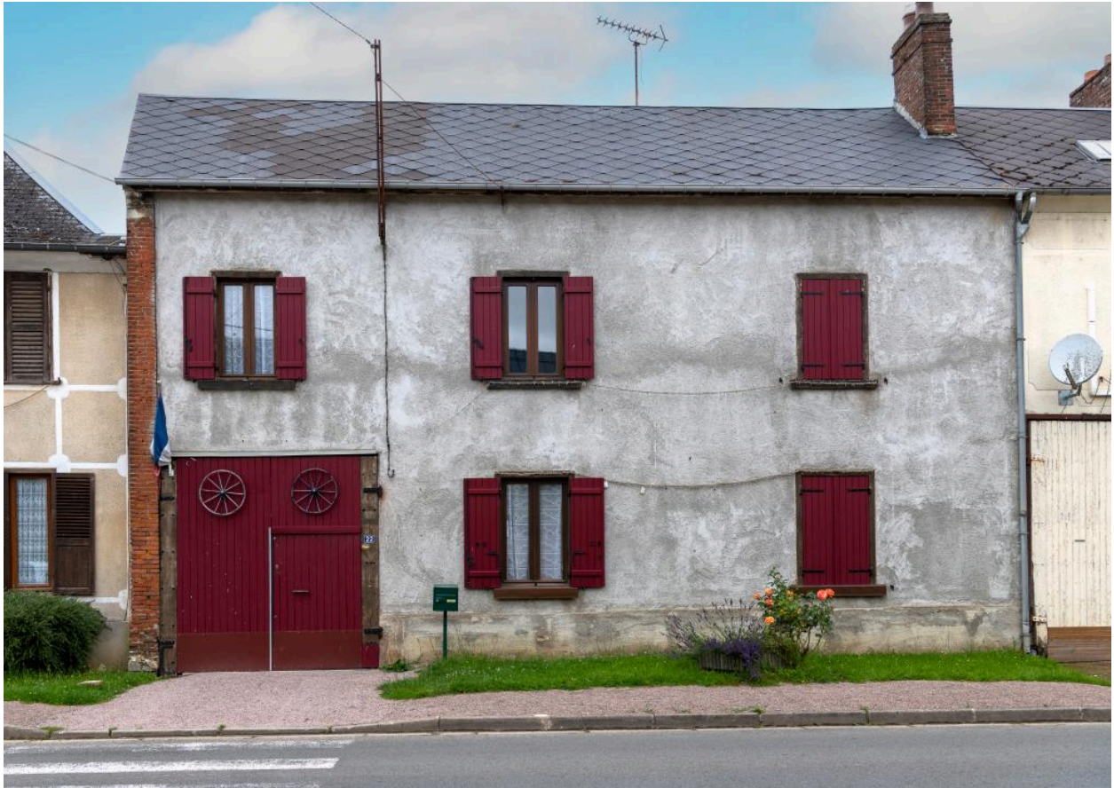
Logis sur rue avec entrée charretière, n°22 rue Principale, vue depuis l'est.