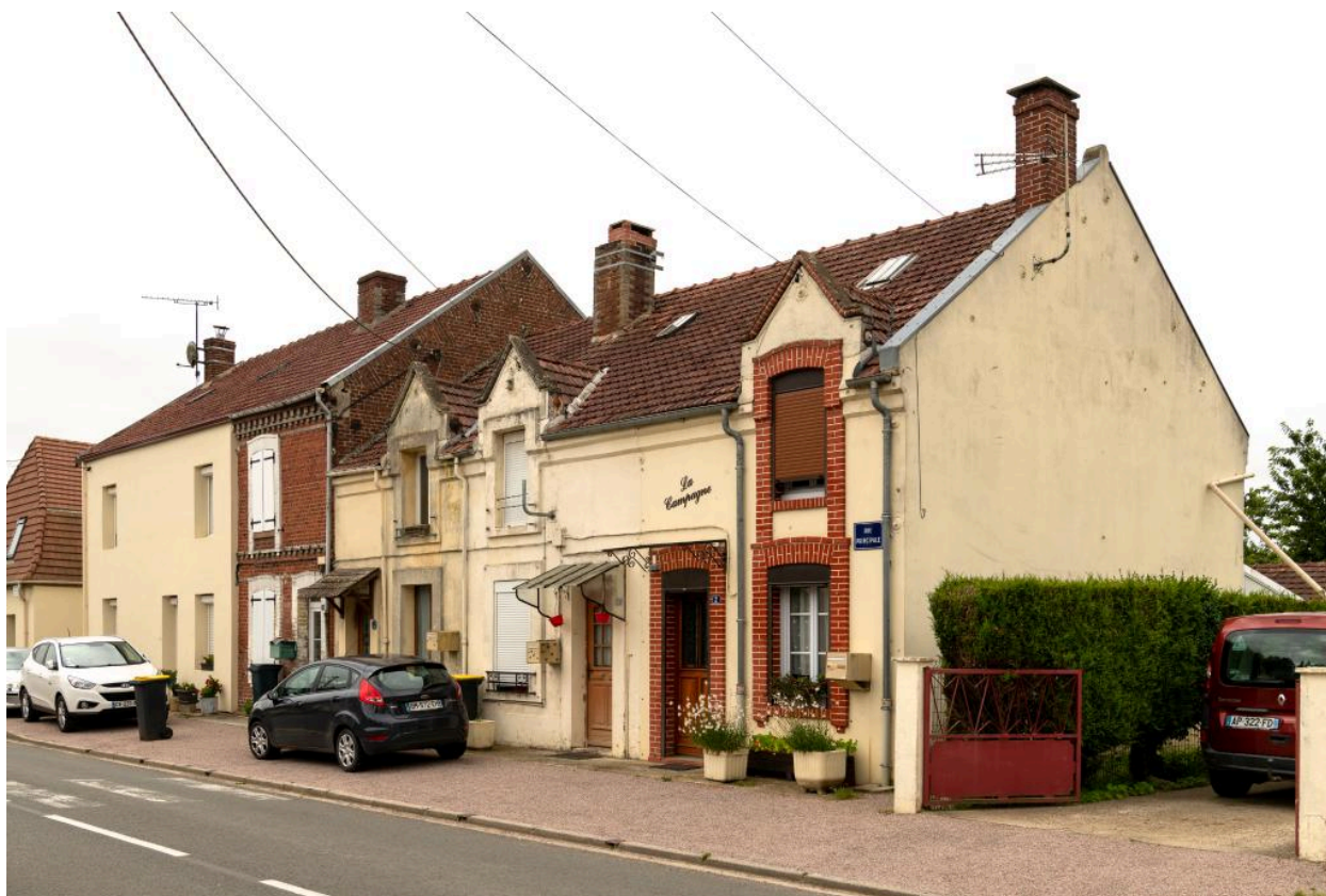
Anciens logements des ouvriers et ouvrières de l'usine textile Lecomte, n°10 à 4 rue Principale, dernier quart 19e siècle, vue depuis le nord-est.