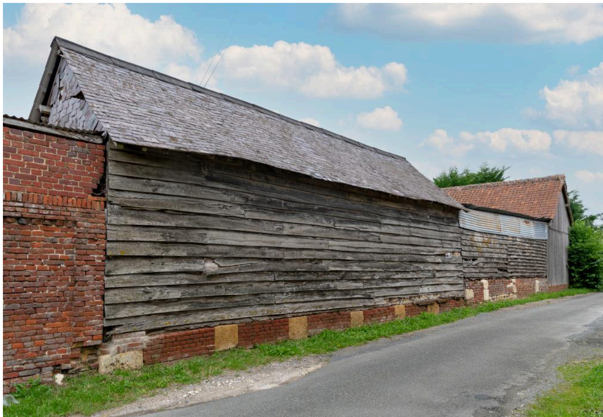
Bâtiment agricole essenté en blins de bois, n°45 rue Principale, vue depuis le sud-ouest.