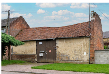
Grange sur rue d'une ancienne ferme, n°40 rue Principale, vue depuis l'est.