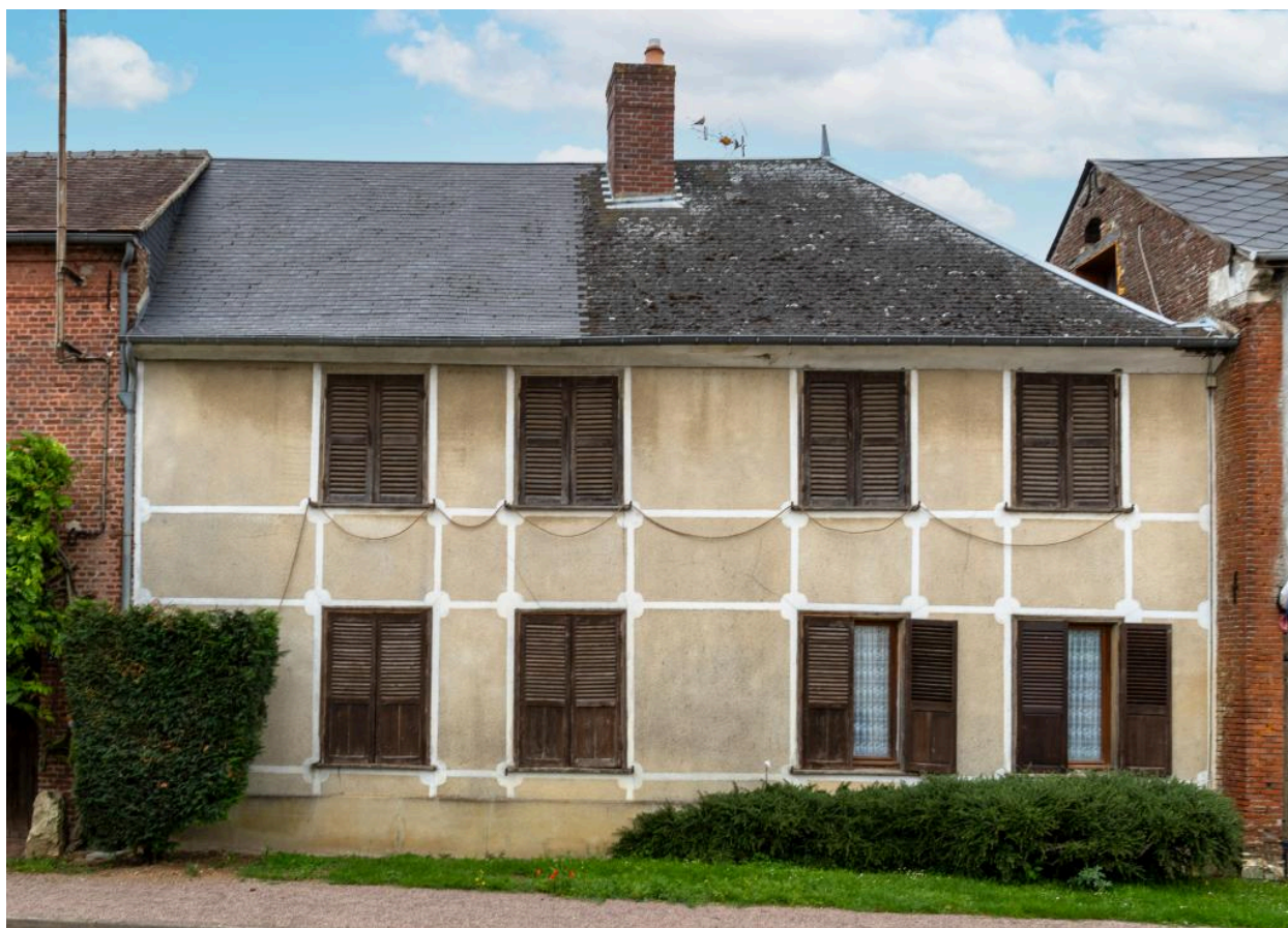
Logis sur rue, n°24 rue Principale, vue depuis l'est.