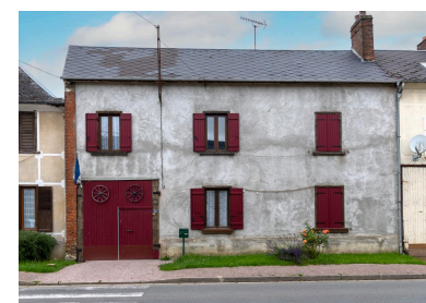
Logis sur rue avec entrée charretière, n°22 rue Principale, vue depuis l'est.