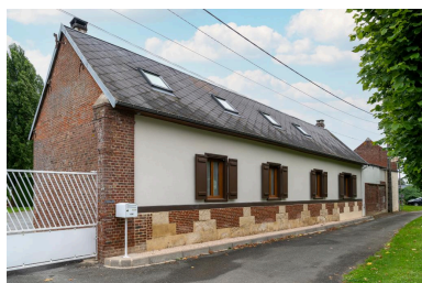
Logis au n°44 rue Principale, vue depuis le sud-est. IVR32_20216000857NUCA