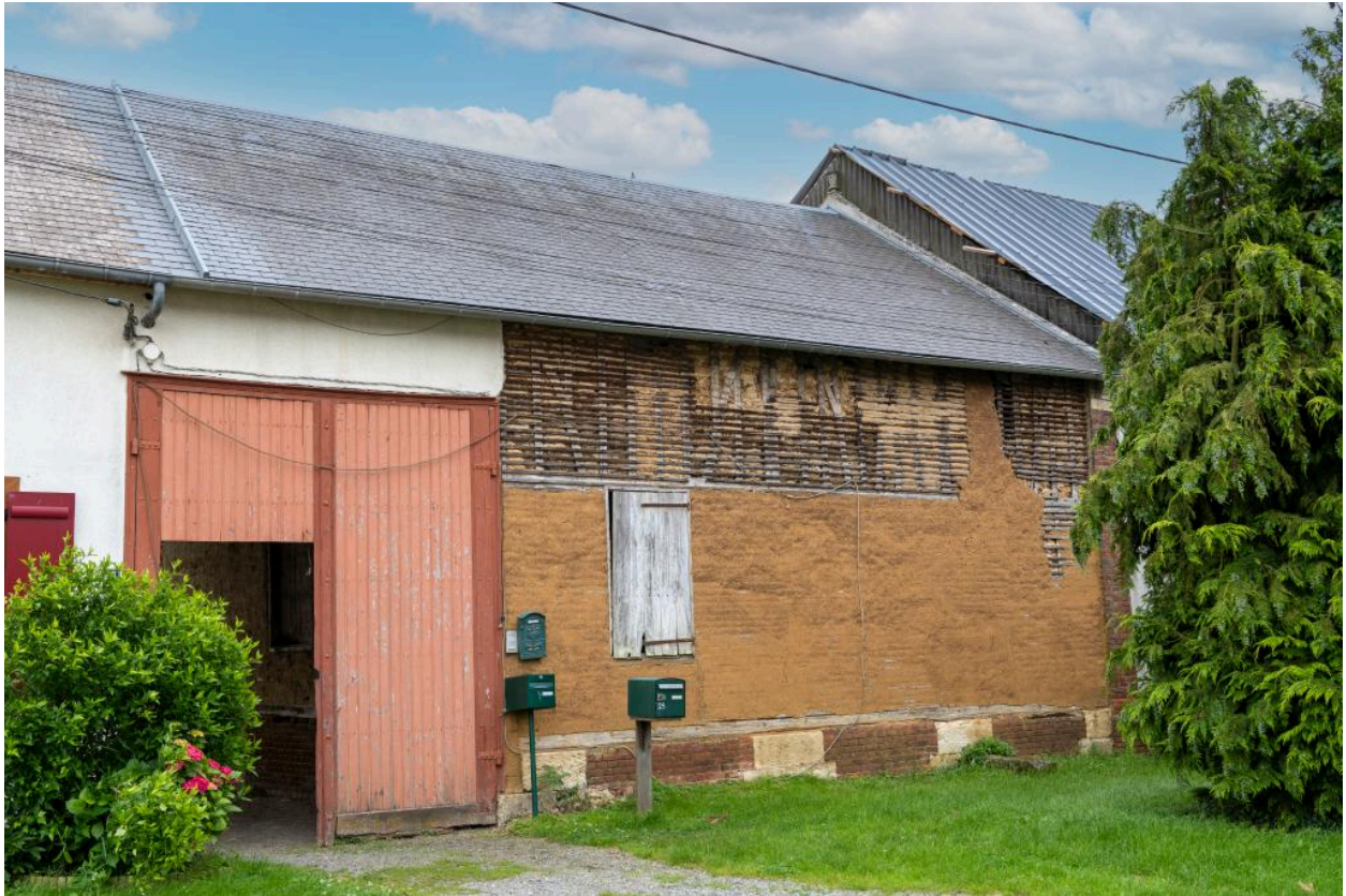
Grange d'une ancienne petite ferme picarde avec entrée charretière et porte à engranger, n°25 rue Principale, vue depuis l'ouest.