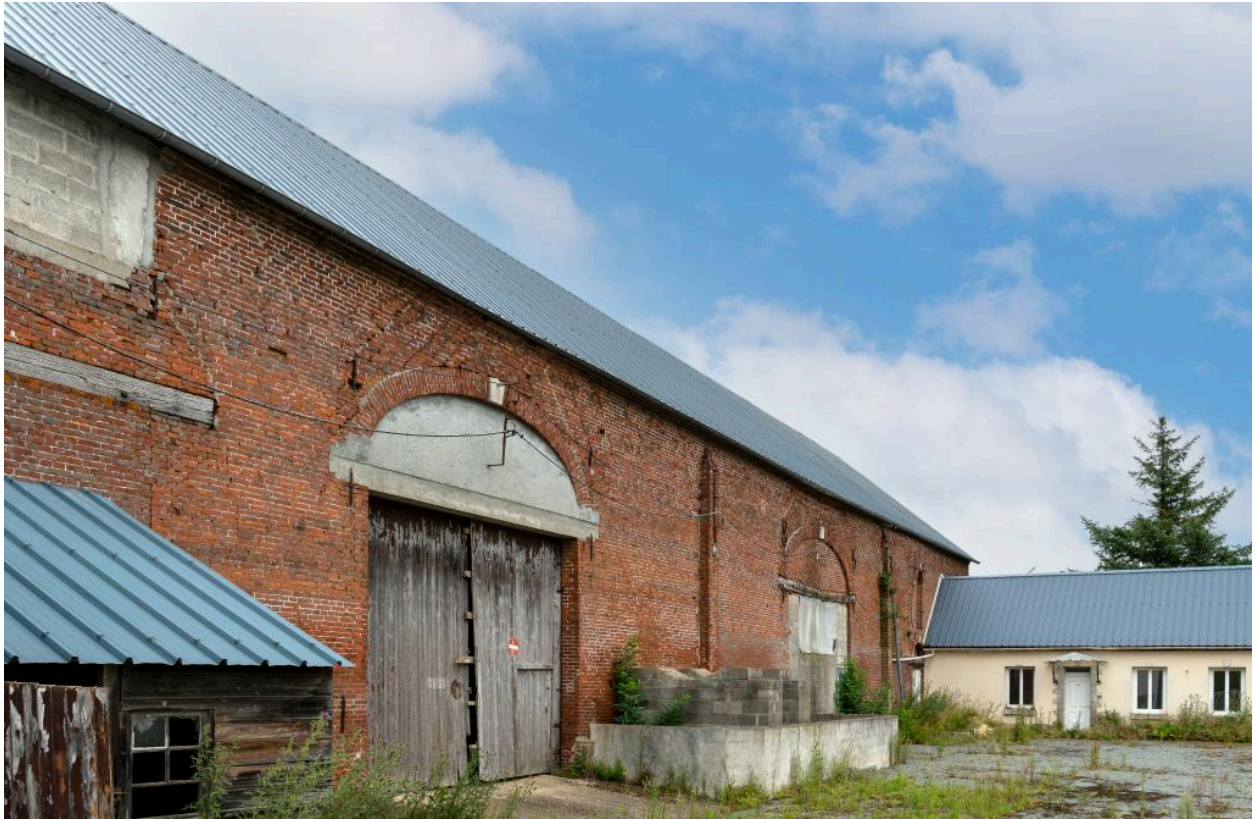
Grange d'une ancienne ferme au n°53 rue Principale, construite en 1853 (date portée), vue depuis le sud-ouest.