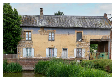
Logis en pans de bois torchis avec entrée charretière, n°50 rue Principale, vue depuis l'est.