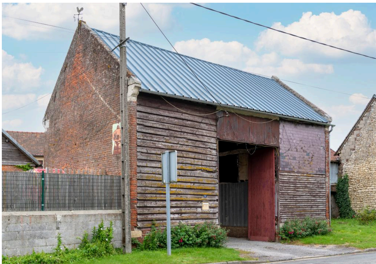
Grange au n°51 rue Principale, vue depuis l'ouest.