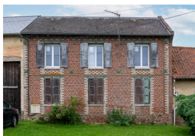
Logis de ferme, 1er quart 20e siècle, n°42 rue Principale, vue depuis l'est. IVR32_20216000860NUCA