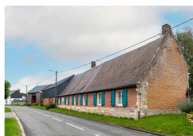
Logis ayant pu appartenir à l'ancien château (ferme?), n°1 rue de l'Église, 18e siècle ?, vue depuis le sud-ouest.

IVR32_20216000845NUCA