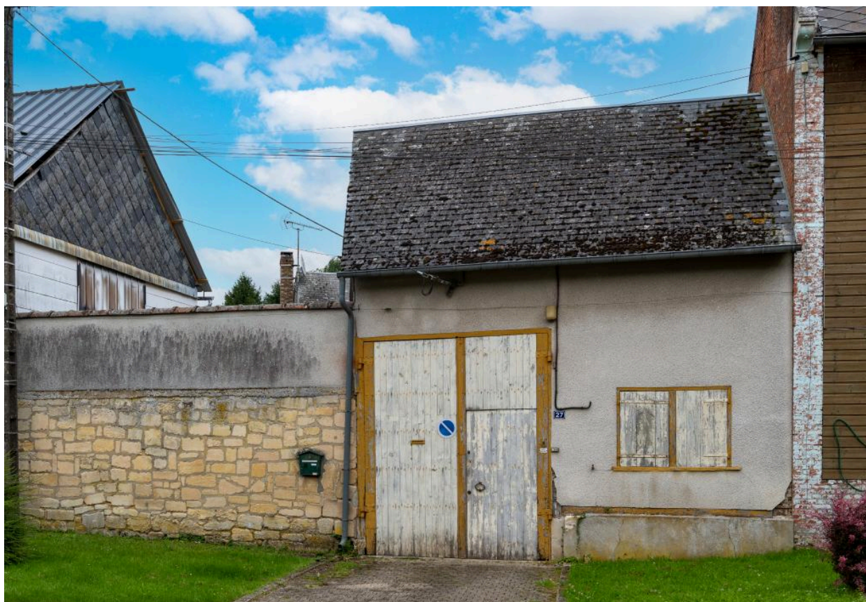
Entrée charretière avec fenêtres à engranger ou fenêtres d'atelier, n°27 rue Principale, vue depuis l'ouest. Le mur à gauche pourrait matérialiser l'ancien emplacement d'une autre grange.