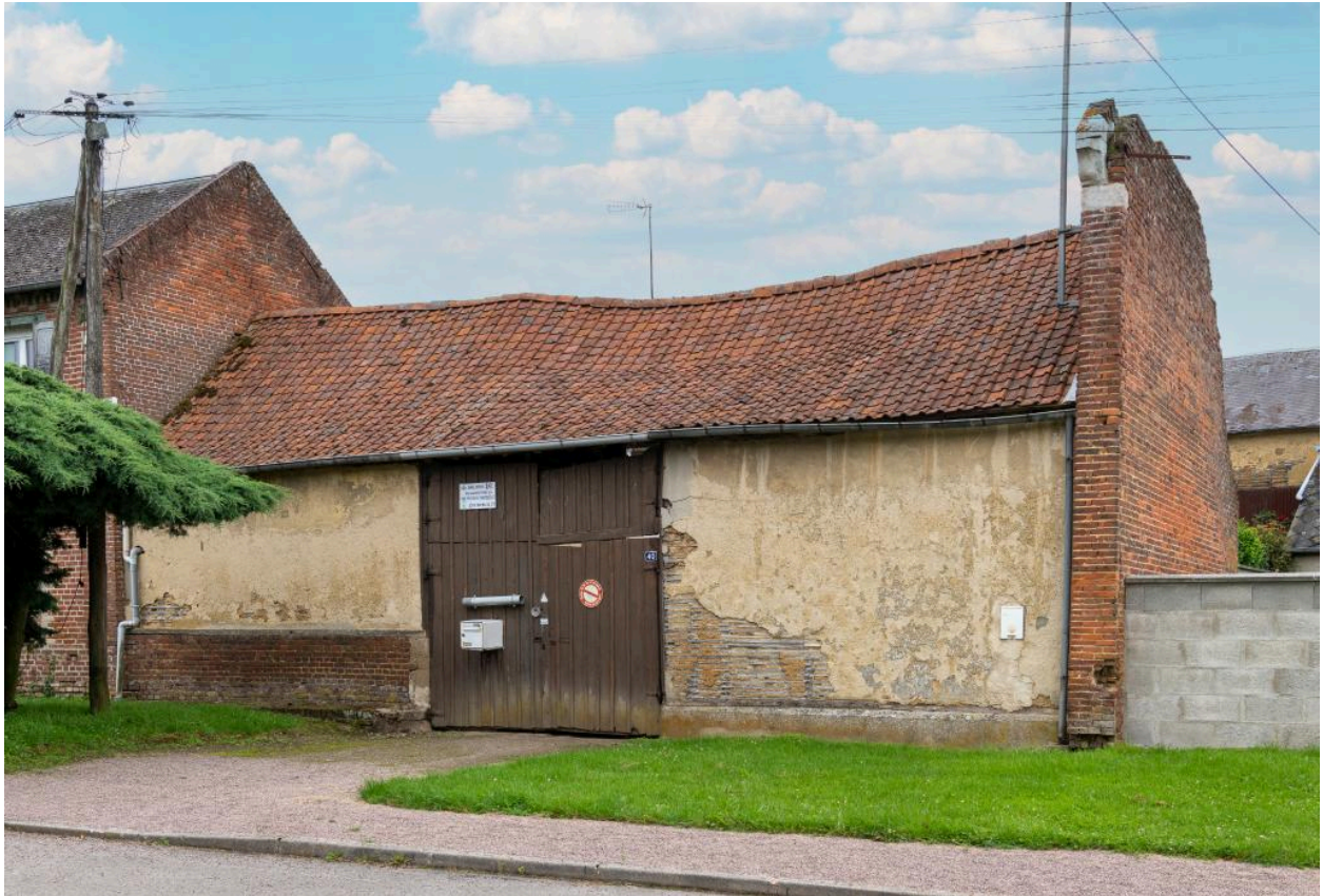
Grange sur rue d'une ancienne ferme, n°40 rue Principale, vue depuis l'est.