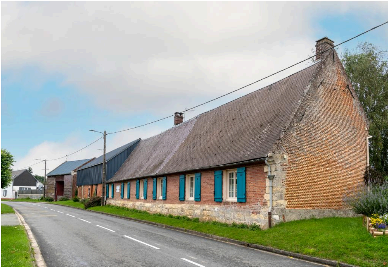
Logis ayant pu appartenir à l'ancien château (ferme?), n°1 rue de l'Église, 18e siècle ?, vue depuis le sud-ouest.