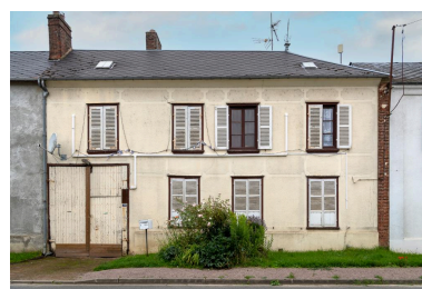
Ancienne boulangerie, n°20 rue Principale, vue depuis l'est.