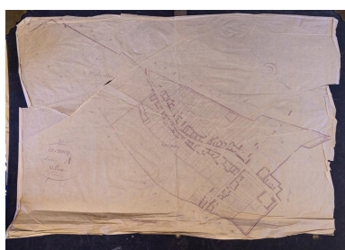
Calque du cadastre dit napoléonien, milieu 19e siècle (coll. communale).

IVR32_20216000840NUCA