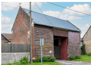
Grange au n°51 rue Principale, vue depuis l'ouest. IVR32_20216000858NUCA