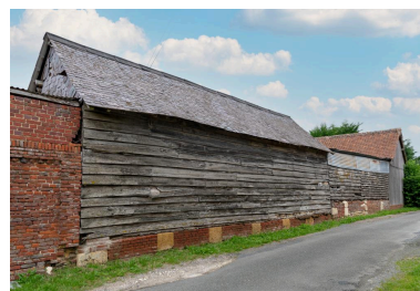
Bâtiment agricole essenté en blins de bois, n°45 rue Principale, vue depuis le sud-ouest. IVR32_20216000859NUCA