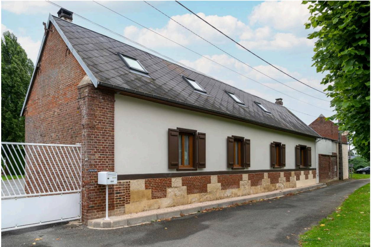
Logis au n°44 rue Principale, vue depuis le sud-est.