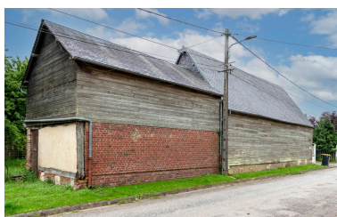
Bâtiments agricoles essentés en clins de bois, n°5 rue de Doméliers, vue depuis le nord-est. IVR32_20216000849NUCA