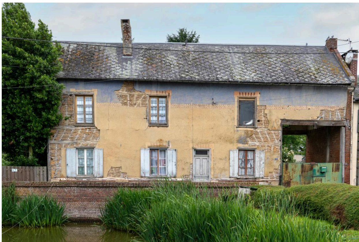
Logis en pans de bois torchis avec entrée charretière, n°50 rue Principale, vue depuis l'est.