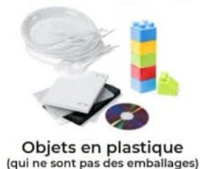
Objets en plastique (qui ne sont pas des emballages)