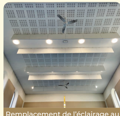
Remplacement de l'éclairage au Centre Sportif et Culturel « La Synagogue »