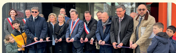
Coupé du ruban

Un après-midi portes ouvertes a suivi et l'ensemble des habitants du village ont été conviés à la visite du bâtiment rénové.