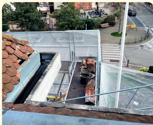
Changement gouttières à la mairie