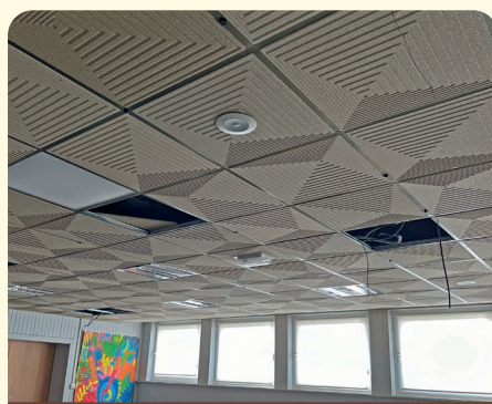
Remplacement de l'éclairage dans la salle socio-éducative