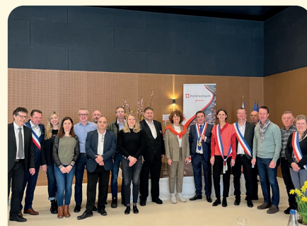
Les élus accompagnés de représentants de la commune de Vimbuch