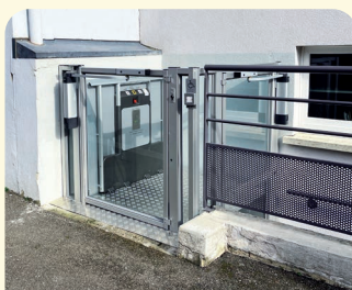
Remplacement du plateau élévateur PMR à l'extérieur de la salle socio-éducative