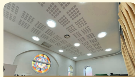
Remplacement de l'éclairage au Centre Sportif et Culturel « La Synagogue » - 1 er étage