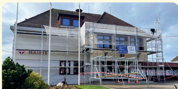
Changement gouttières à la mairie