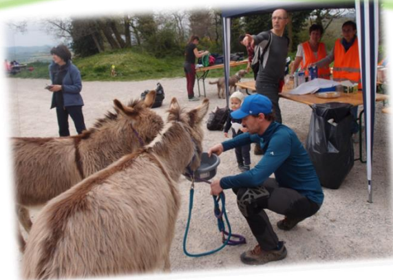
Rando des crêtes