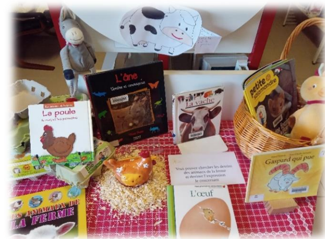
Le thème du moment : les animaux de la ferme.

« BBlecteurs » ; des ateliers musique et des spectacles. Mais les plus grands ne sont pas oubliés pour autant ! C'est à eux que s'adressent les soirées jeux de société (1 er samedi du mois), les soirées jeux de cartes (3 ème mercredi du mois) ; des concerts, représentations théâtrales, expositions, et concours. Et tout ça dans une ambiance cosy car la décoration change selon les saisons (voir photo).