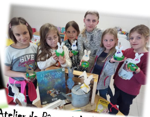
Atelier de Pâques à la Médiathèque