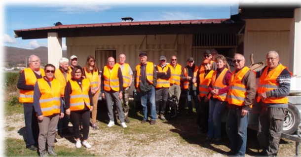
Opération nature propre