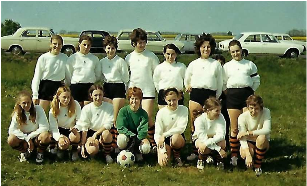
Equipe féminine en 1970 :