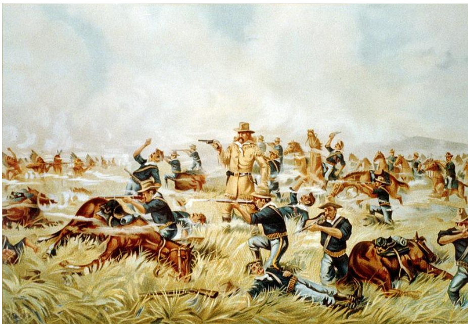
Ci-dessus : tableau représentant la bataille de Little Big Horn