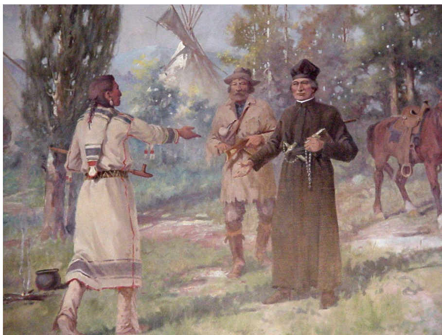
Ci-dessous : représentation du missionnaire jésuite Ravalli au contact des Amérindiens

Le Montana est un État du nord des États-Unis, dont la capitale est Helena et la plus grande ville Billings. Montana est un mot latin désignant une région montagneuse, tout à fait adapté à la topographie de cet état. Quatrième plus grand état par la superficie et septième moins peuplé des États des États-Unis, il est l'un de ceux ayant la plus faible densité de population avec l'Alaska et le Wyoming (2,39 hab/km 2 ). Bordé à l'ouest par l'Idaho, à l'est par le Dakota du Sud et le Dakota du Nord, et au sud par le Wyoming, il est frontalier du Canada au nord en touchant les provinces de la Colombie-Britannique, de l'Alberta et de la Saskatchewan. Territoire rural au climat continental, ses paysages alternent entre larges vallées dominées par les imposants sommets des Rocheuses à l'ouest, et vastes plaines fertiles à l'est. Son réseau hydrographique est très important : plusieurs affluents du Missouri (la Yellowstone, la Milk, la Musselshell) traversent l'État de part en part, formant de nombreux canyons et cascades.