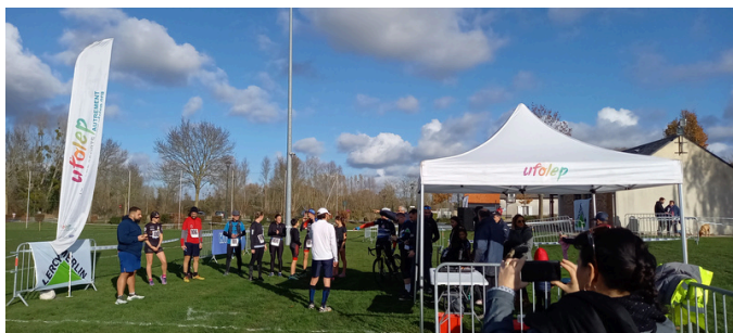
Cyclocross du Téléthon

Merci au Comité des Fêtes, l'APE les Ecureuils, l'Amicale de Dry, La Bibliothèque de Dry, le Club des Aînés, Les Ateliers de Dry, Meung Cyclisme, La Pêche aux Légumes et le Café de la Paix pour leur mobilisation.