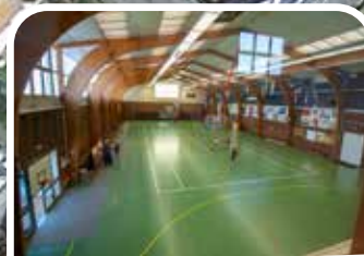
SALLE ET TERRAIN DE SPORTS