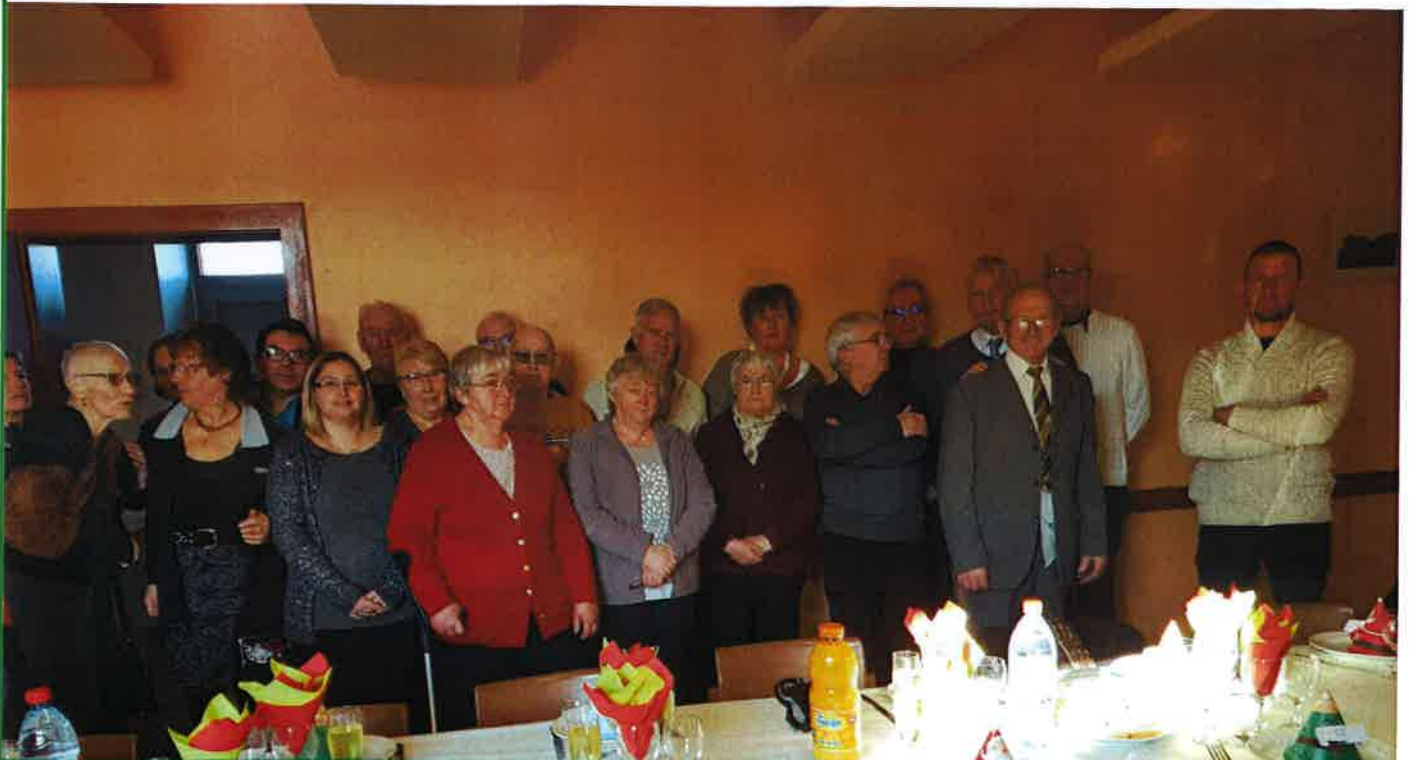
Le repas des anciens