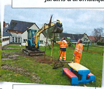
Plantation de Prunus dans les jardins de l'école maternelle