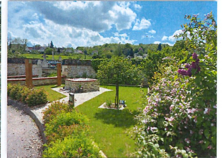
Finalisation du jardin du souvenir au cimetière