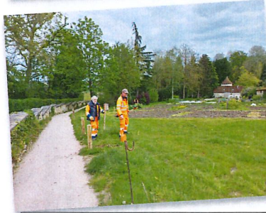
Pose de bornes pour délimiter le sentier des écoliers et les jardins communaux