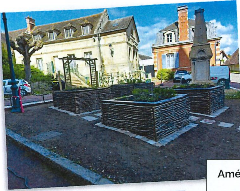
Aménagement de la place Aristide Briand : création de jardins d'aromatiques et d'un trottoir.