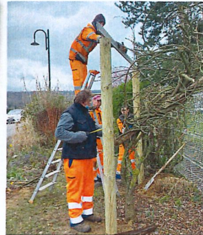
Remplacement des pergolas, rue des Buttes