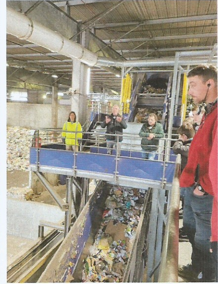
Visite du Smédar

Et enfin la visite du Sénat à Paris le 20 décembre !