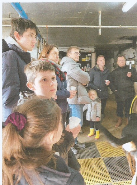
Participation à la traite....