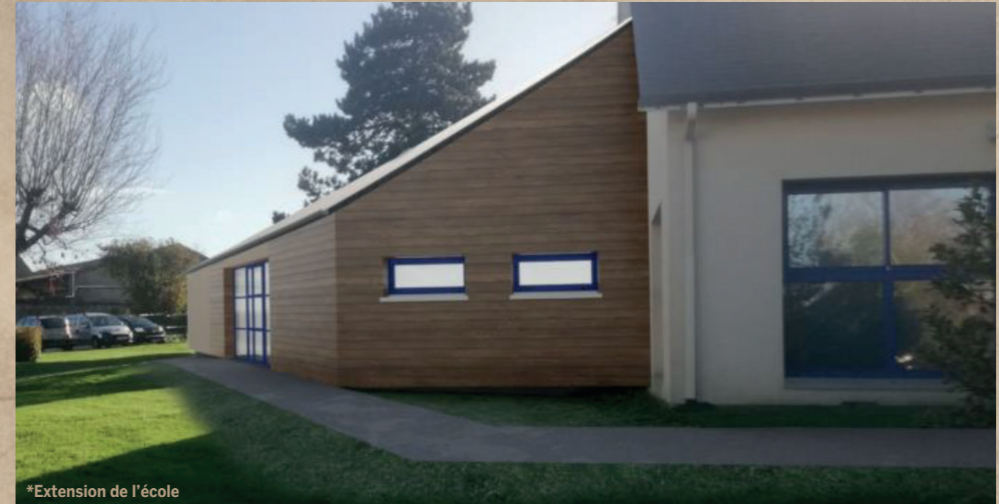
*Extension de l'école