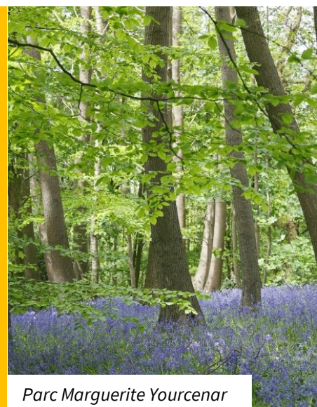
Parc Marguerite Yourcenar