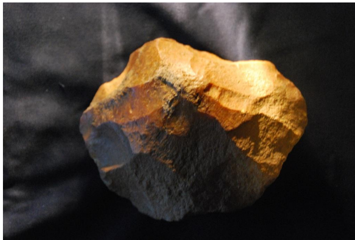
Galet aménagé ( shopping tool)

Les outils très grossiers les plus anciens trouvés à Champagné, sont nommés par les spécialistes « shopping tool » (galets aménagés). Ils consistent en de simples galets ou silex légèrement taillés pour trancher et très difficiles à dater, mais proviennent de civilisations bien au-delà de 500 000 ans.