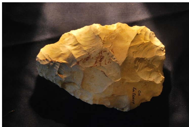
Biface Moustérien de tradition Acheuléenne 1

La grande période importante sur notre sol fut ensuite la période Moustérienne, avec en premier lieu, la civilisation Moustérienne de tradition Acheuléenne (St-Acheul), de 300 000 à 200 000 avant notre ère.