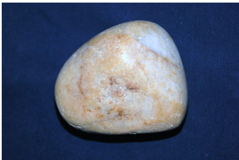
Polissoir en quartz