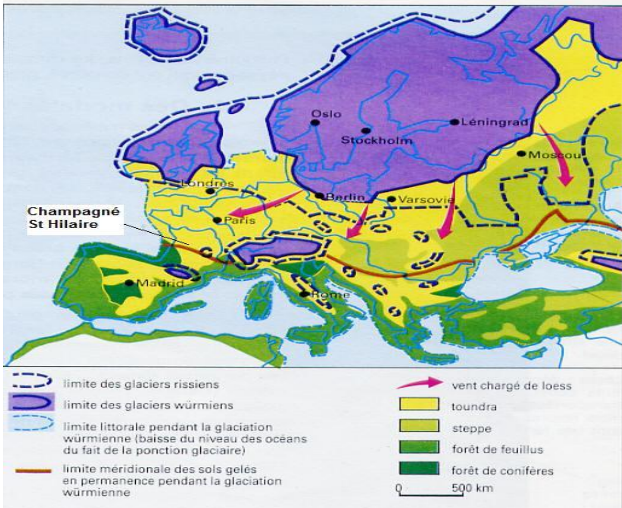
La carte de l'avancée des glaciers durant les périodes glacières

Ci-dessus, les différences de températures durant les glaciations du Quaternaire il y a 20 000 ans (la T° à Champagné à cette époque devait osciller entre, au maximum + 15° l'été et - 20° l'hiver). Un permafrost (sol gelé en permanence) devait rendre l'habitat très difficile sans les grottes protectrices comme dans le Périgord.