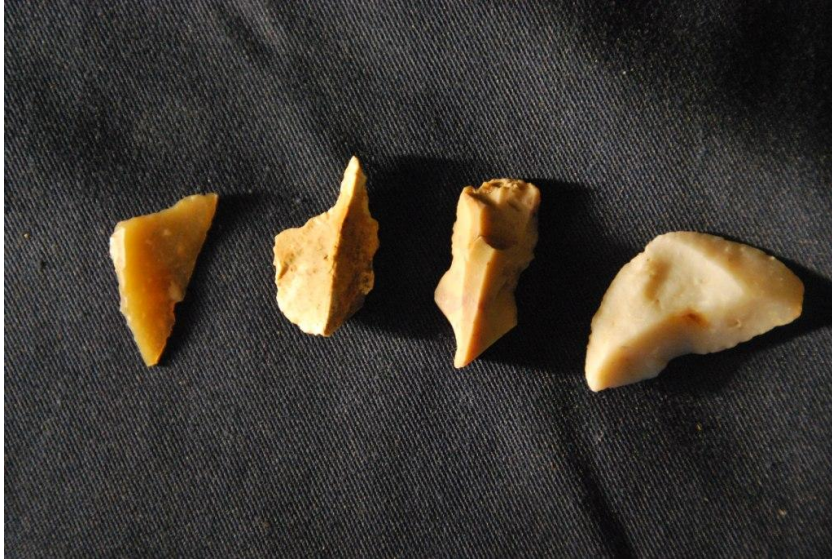
Microlithes Néolithiques taillés en micro-burins et perceurs

Les industries sont autour des microlithes adaptés à l'emmanchement sur os, bois de cervidé, bois durs