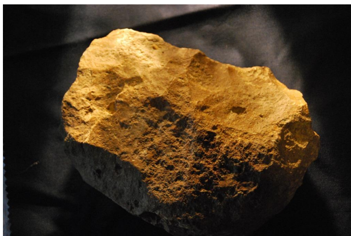
Silex aménagé (shopping tool)