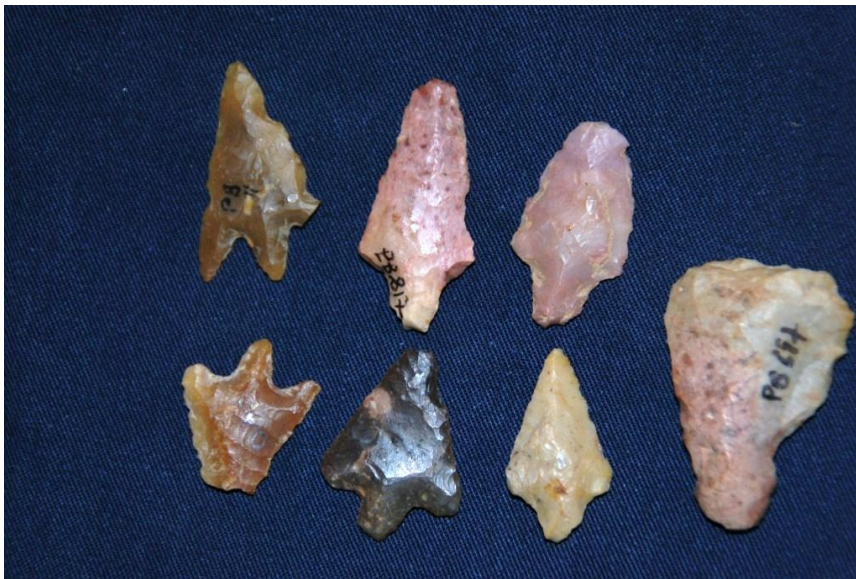
Pointes de flèches et tranchants Néolithiques

Mais aussi nous trouvons des pièces travaillées comme les pointes de flèches