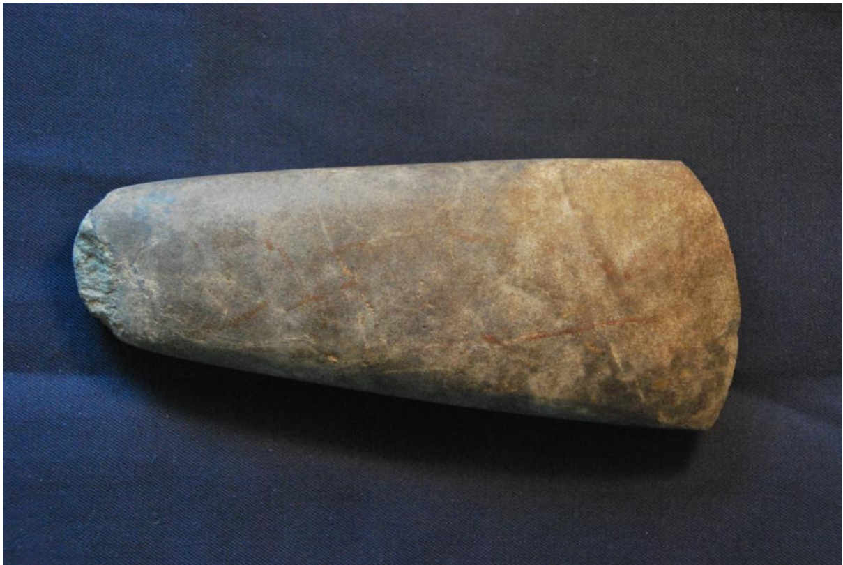
Hache polie de 15X6 cm