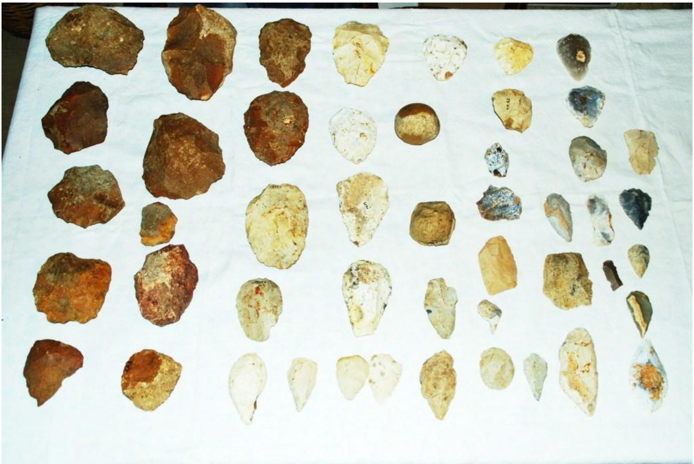
Petit aperçu de la collection prélevée sur le territoire de Champagné

Ces pierres sont des industries lithiques ou plus simplement de outils préhistoriques