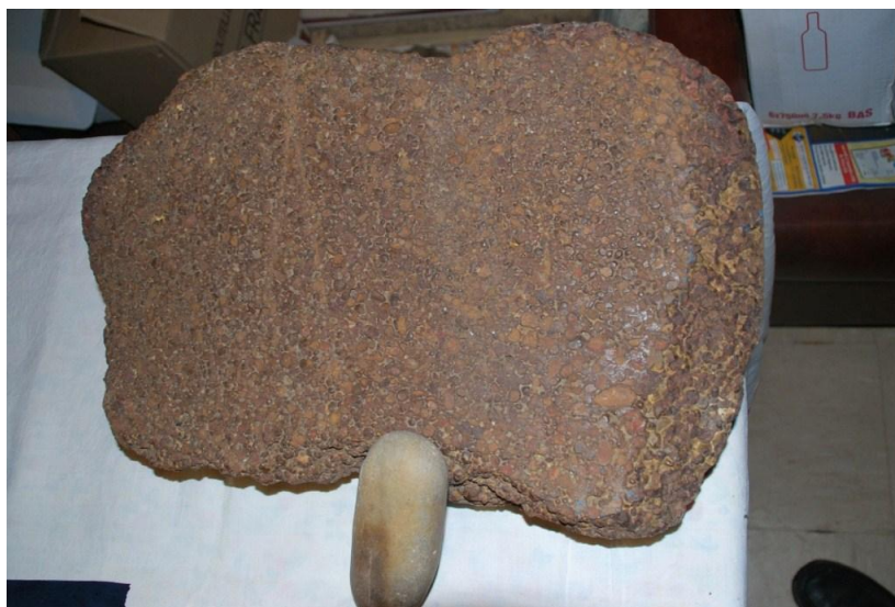
Meule de polissage en pisolithe