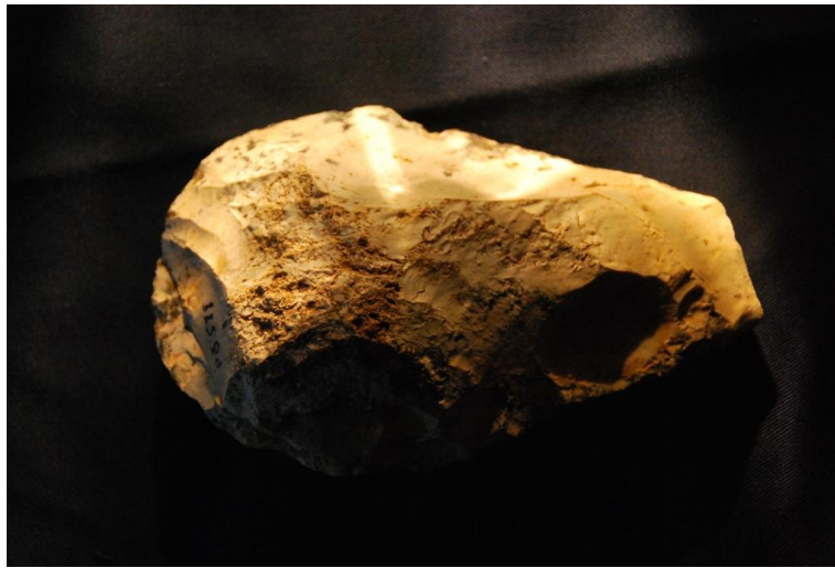
Biface Moustérien de tradition Acheuléenne 2

Chaque civilisation, de par le monde utilise les mêmes techniques de fabrication et nous retrouvons pour chacune d'elles des cotes d'outils identiques (ex : le biface Acheuléen est amygdaloïde et de taille +ou - 10 x 6 cms) .