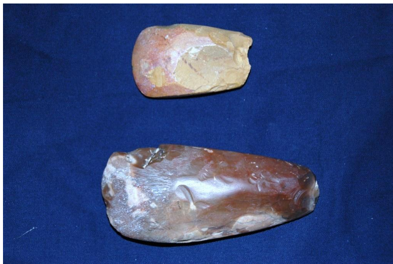
Haches polies Néolithiques

Elle est la période d'outils affinés et sophistiqués avec polissage (haches polies) sur meule.