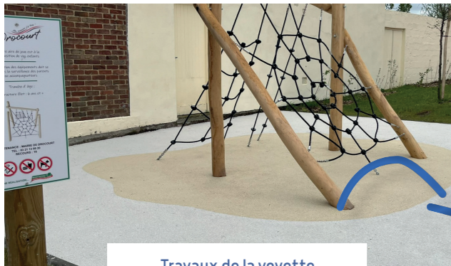
Travaux de la voyette

Pour parfaire ce cadre agréable, des plantations (d'essence majoritairement locales) ont été réalisées.