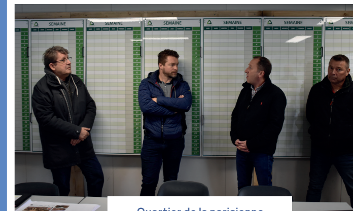
Quartier de la parisienne