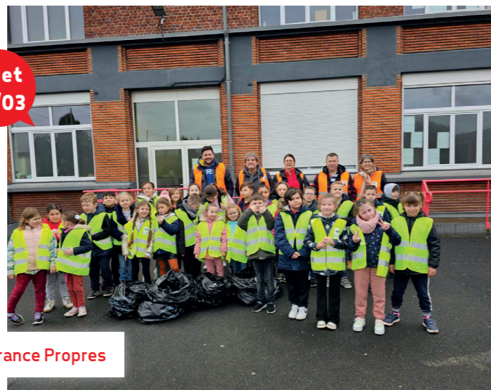
Hauts de France Propres