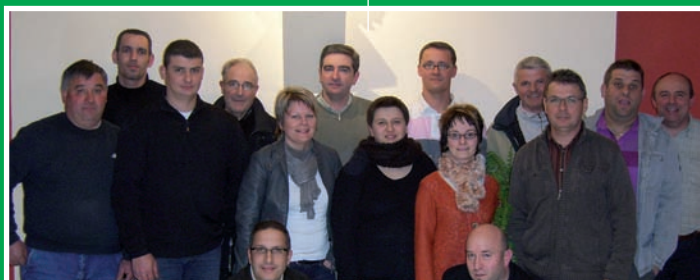
Association REV (Réseau d'Entreprises Vicomtaises)