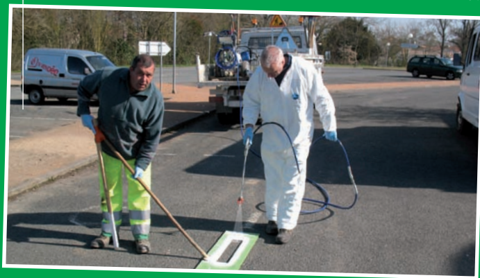
Traçage signalisation voirie par les employés communaux