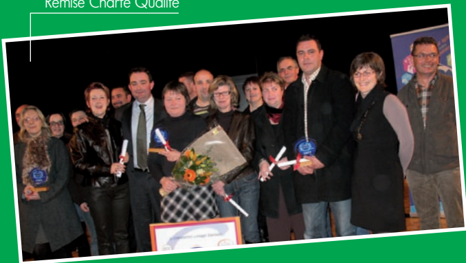
Remise Charte Qualité