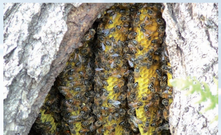
Abeilles Noires installées dans la vallée verte