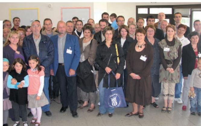
Accueil des nouveaux arrivants