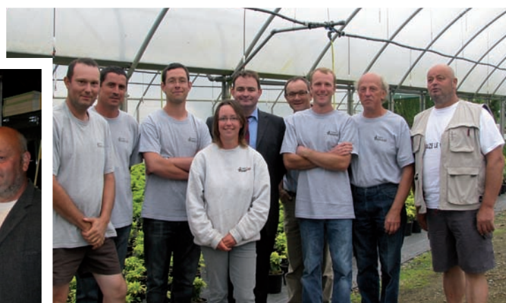
Visite de Végétal 85