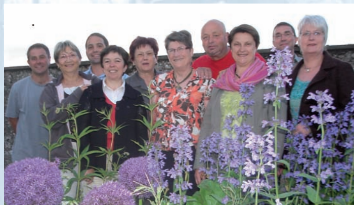
Jury « Paysages de votre commune »