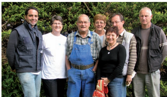
Le groupe des baliseurs de nos sentiers pédestres