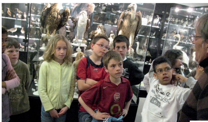
Visite du Musée par le Conseil Municipal Enfants