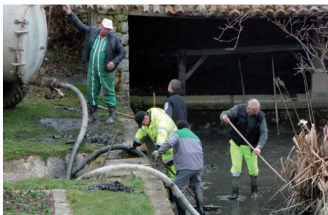
Nettoyage du lavoir