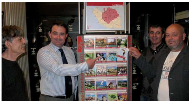
Présentoir du Conseil Général installé au Musée Charles Payraudeau