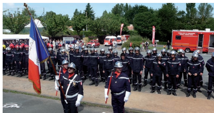
125 ans des sapeurs pompiers