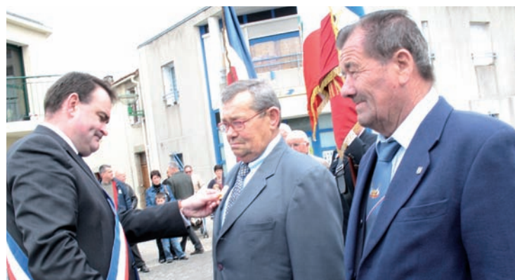
Remise des décorations du 8 mai 2009