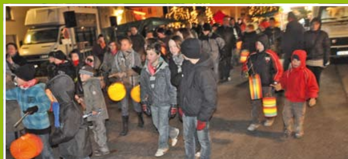
Veillée aux lampions