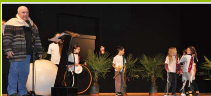
Les élèves de l'École de cirque lors des vœux du Maire aux habitants