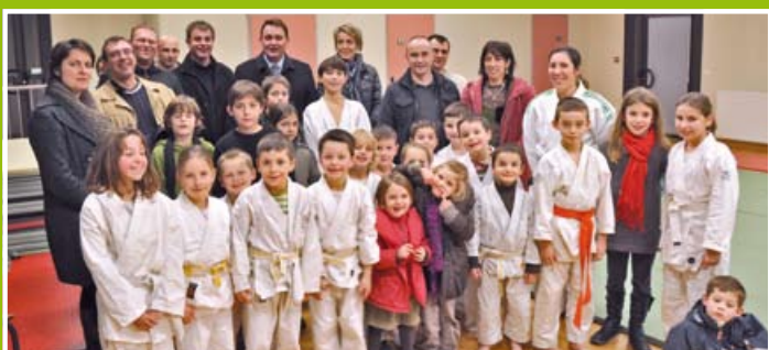
Inauguration du nouveau tatami au club de judo