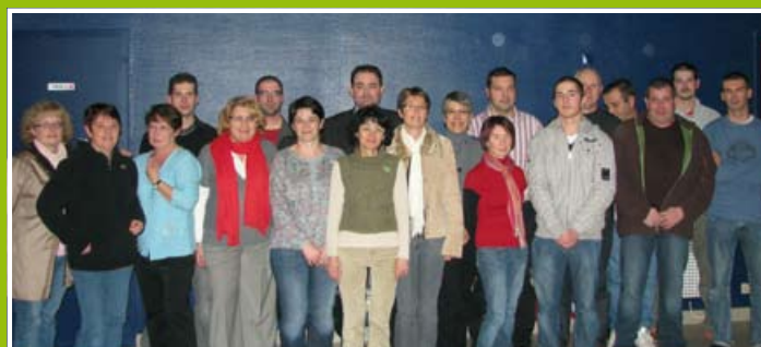
Vœux du Maire au personnel de la Mairie