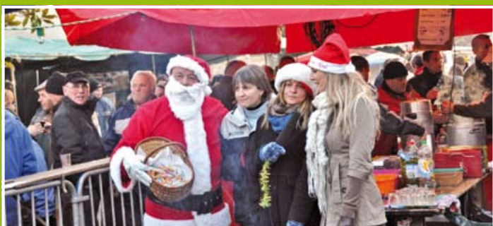
Marché de Noël