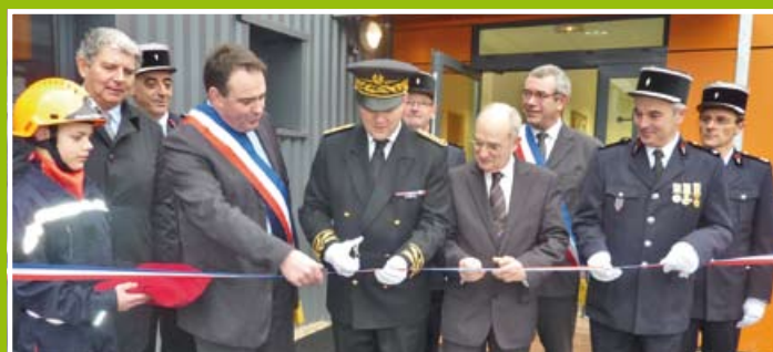
Inauguration du nouveau centre de secours