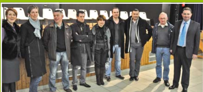
Accueil des nouvelles entreprises