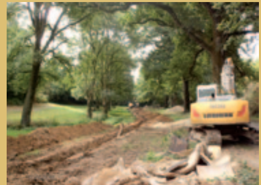
Conduite de refoulement