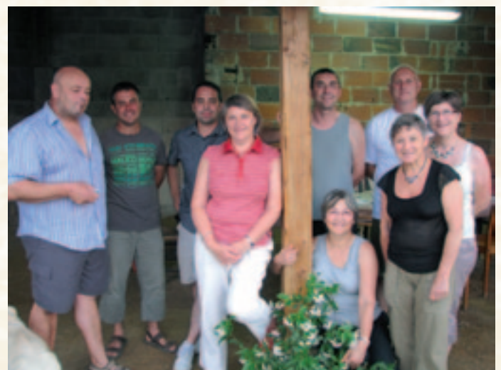
Les membres du jury