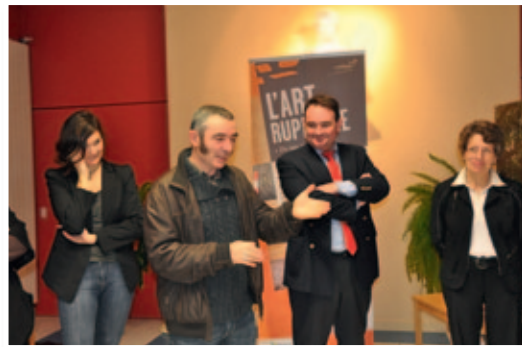
Exposition sur la Préhistoire