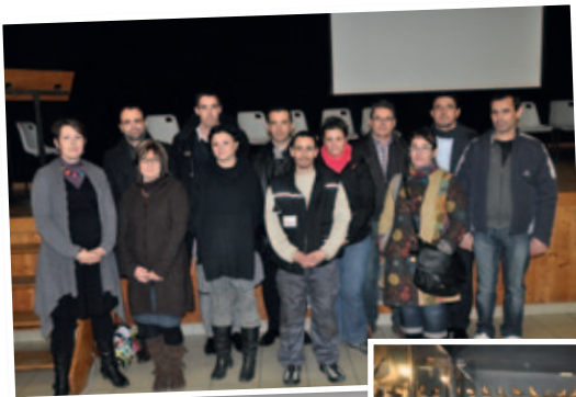
Accueil des nouvelles entreprises