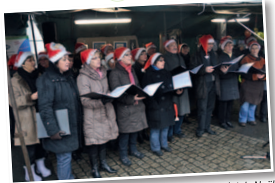
La chorale Vicante au marché de Noël