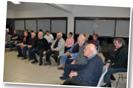
Rencontre entre jeunes et anciens conscrits