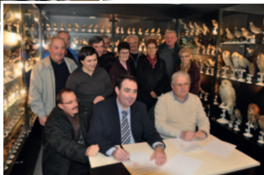
Signature du contrat entre la commune et Ethnodoc qui met sa banque de données à disposition des Vicomtais.