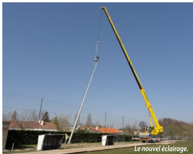
Le nouvel éclairage.

Enfin il est arrivé ! La première mise en service a eu lieu le mercredi 9 mars. Les joueurs du F.E.C. ont pu s'entraîner le vendredi 11 mars sous les nouvelles lumières du stade du moulin rouge.