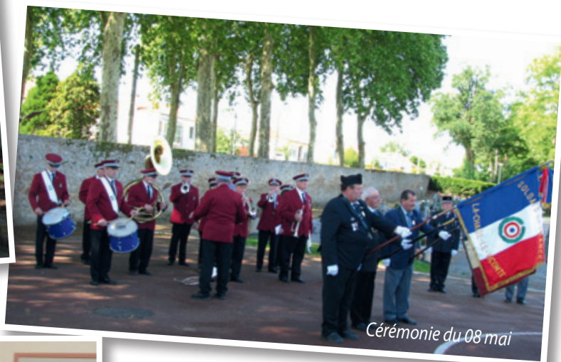
Cérémonie du 08 mai