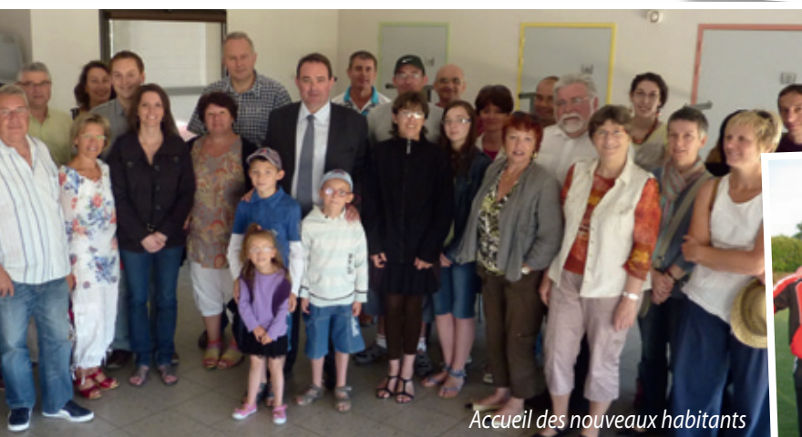
Accueil des nouveaux habitants