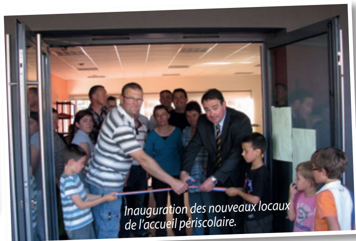
Inauguration des nouveaux locaux de l'accueil périscolaire.