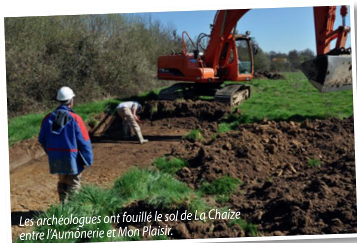
Les archéologues ont fouillé le sol de La Chaize entre l'Aumônerie et Mon Plaisir.