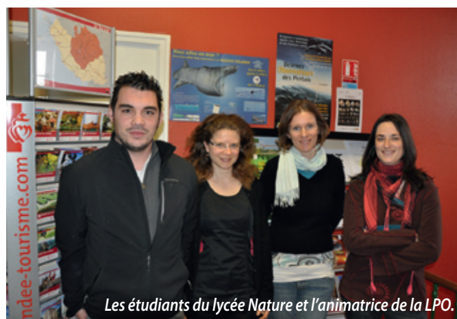
Les étudiants du lycée Nature et l'animatrice de la LPO.

Et pendant ce temps, le musée ornithologique Charles