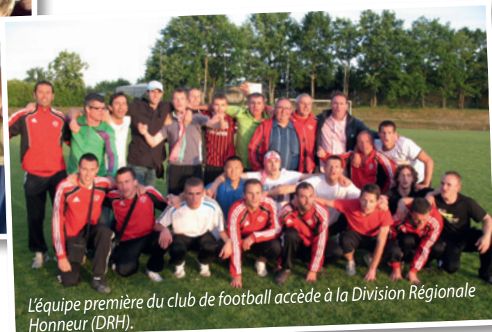
L'équipe première du club de football accède à la Division Régionale Honneur (DRH).