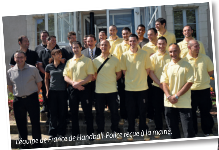
L'équipe de France de Handball-Police reçue à la mairie.