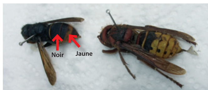
A gauche frelon asiatique, à droite frelon d'Europe

Son nid est à signaler à la FDGDON, La Roche sur Yon, au 02 51 47 70 61. Le coût de l'intervention de destruction est, en partie, pris en charge par le Conseil Général.