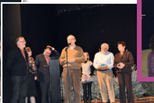
Voeux du Maire. Mise à l'honneur des bénévoles pour les visites de l'été