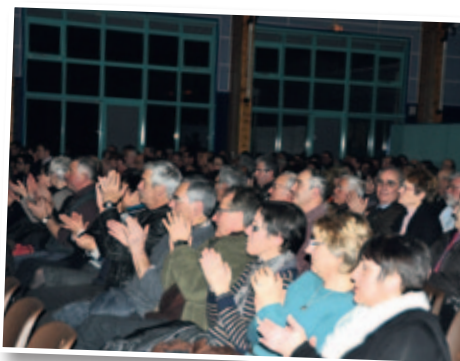
Voeux du maire