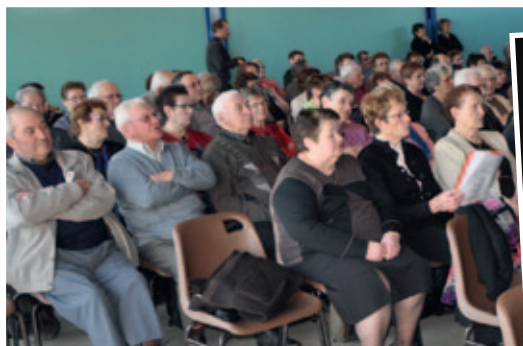
Goûter des aînés