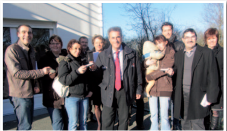
Remise clés des logements - Résidence Les Aquarelles