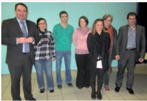
Nouveau personnel à la mairie en 2012 avec M. le Maire et M. Le Directeur Général des Services