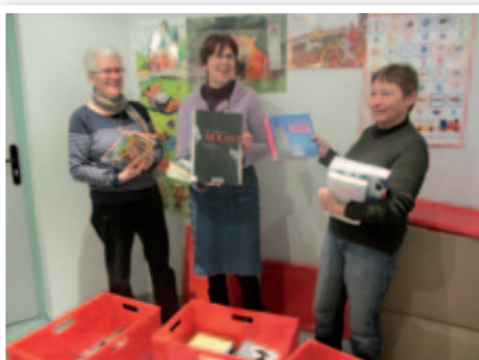
Bibliothèque - Réception du bibliobus