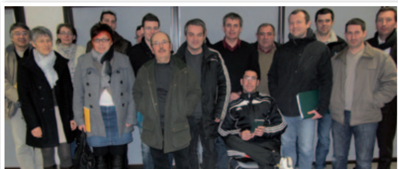
Formation adressée aux associations