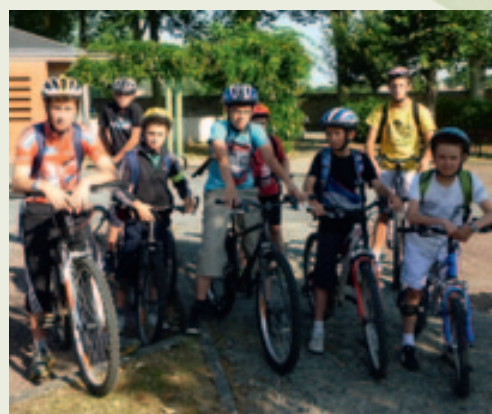
Animation jeunesse de l'été