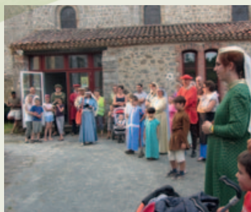
Visite Guidée Si La Chaize m'était contée