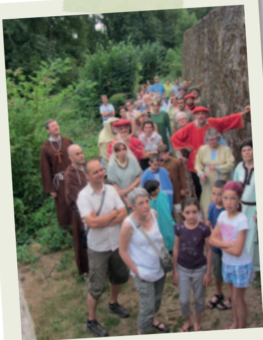
Visite Guidée Si La Chaize m'était contée