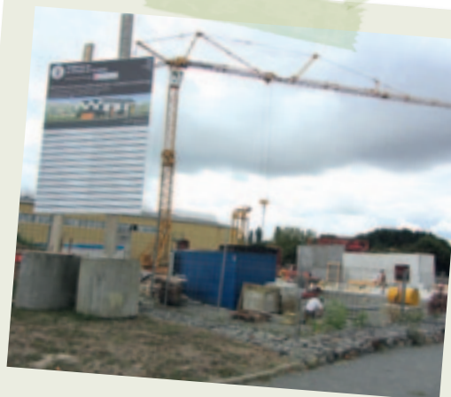
Chantier de l'école Pierre Perret