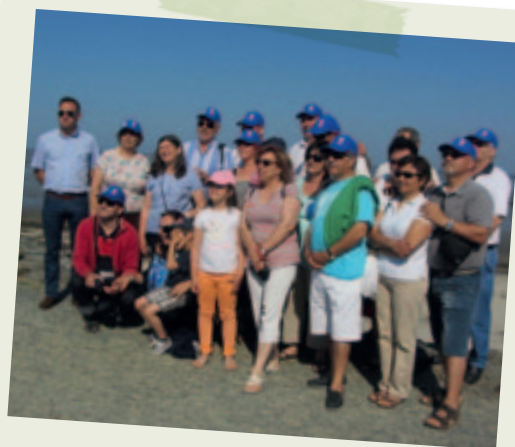
Accueil des Portugais (en visite à Noirmoutier)