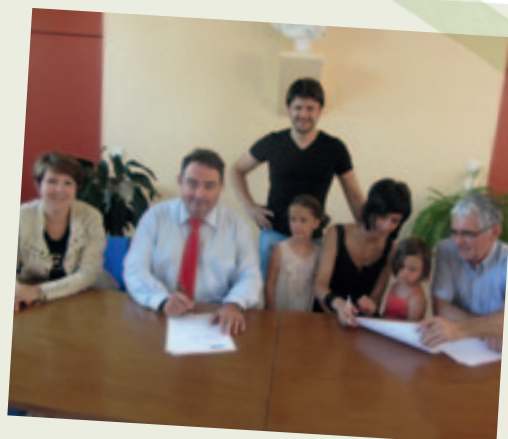
Prêt d'honneur pour l'entreprise Zantedeschia