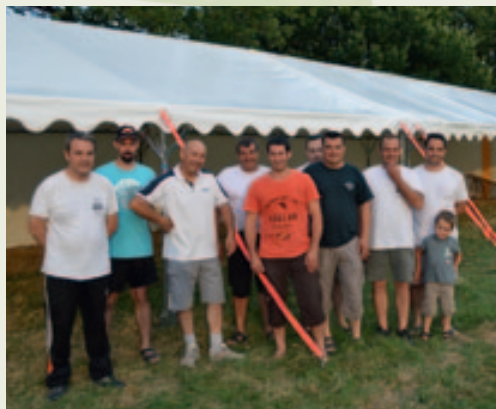
Nouvelle tente pour le Comité des Fêtes