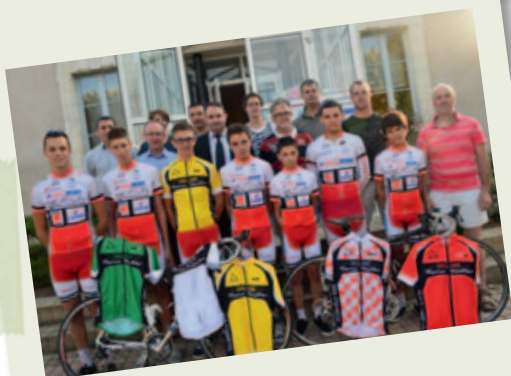
Challenge Thomas Voeckler