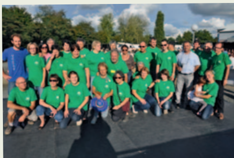
Virades de l'espoir 2013