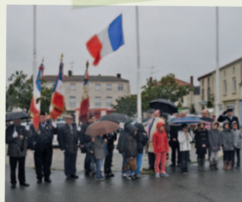
Cérémonie du 11 novembre avec la participation du CME