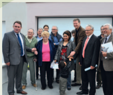
Remise de clés de 2 logements Lotissement de l'Herbrère