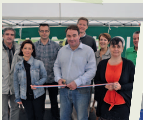
Portes ouvertes en Zone Industrielle