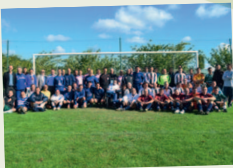
Les policiers footballeurs reçus à La Chaize