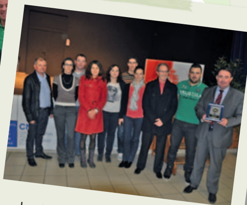
Les jeunes bénévoles honorés par les médaillés de la Jeunesse et des Sports