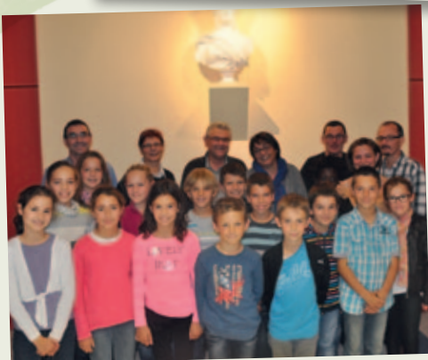
Première séance du CME