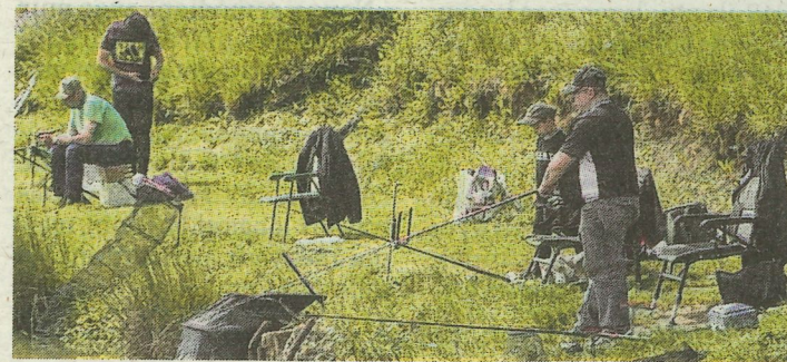
Les pêcheurs étaient présents de bon matin pour espérer attraper une prise.

Ce week-end, la Gaule Boulangeoise accueillait près de 50 pêcheurs à la journée truites. Le temps a été de la partie et tout autour de l'étang de Bassompierre, et dès 7 h 30, les amoureux et amoureuse de la pêche mettaient à contribution leur gaule. À l'heure du repas de midi, une porchetta ravivait les pêcheurs qui l'ont presque autant appréciée que la journée truites.