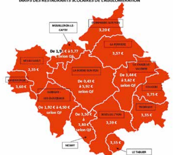
TARIFS DES RESTAURANTS SCOLAIRES DE L'AGGLOMERATION

À titre de comparaison, voici les tarifs appliqués dans les communes de l'Agglomération