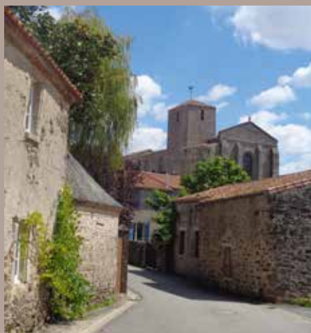
L'église vue de la rue de Virecourt.

La Chaize-le-Vicomte possède un riche patrimoine : son église du XI ème siècle, son musée ornithologique et son bourg de caractère. Profitez des visites organisées au cours de ces deux journées pour découvrir ou redécouvrir ce patrimoine.