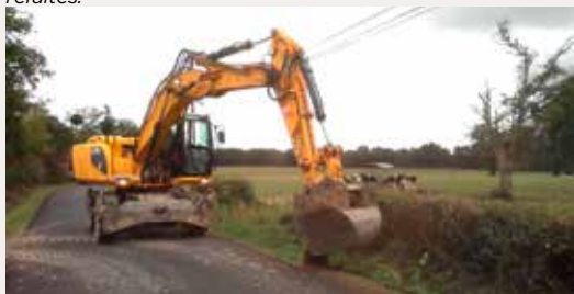
Remise à niveau des accotements sur les routes fraîchement refaites.

Dans l'optique d'améliorer la sécurité de tous les usagers de la route, y compris piétons et cyclistes, deux liaisons douces vont voir le jour. Les travaux de la 1 ère au niveau de La Grangimare ont déjà débuté. Pour la 2 ème située en entrée de bourg en provenance de La Roche-sur-Yon, les travaux auront lieu en début d'année 2021. Le coût total de cette opération s'élève à 109 929,28 euros TTC. Les services de la communauté d'agglomération assurent la maîtrise d'œuvre et l'entreprise attributaire du chantier est « COLAS ». Nous remercions les riverains de leur compréhension, eux qui ont pu ou qui vont être gênés par les travaux.