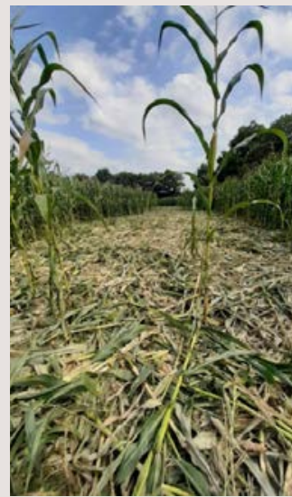
Photo: Dégâts de sangliers dans un champ de maïs vicomtais

Au sein de notre territoire, il est important d'assurer une régulation du gibier (corbeaux, sangliers, blaireaux, renards...). Il s'agit d'une question de sécurité publique. Les gibiers peuvent causer directement ou indirectement de graves accidents de la circulation. Cette régulation permet également de protéger notre agriculture en limitant les dégâts sur les cultures. Il s'agit aussi d'une question de sécurité sanitaire, certains animaux sauvages étant porteurs de maladies (ex : peste porcine africaine pour le sanglier). Les chasseurs ont un rôle essentiel.