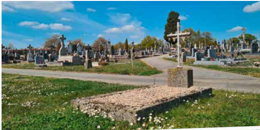
Une politique Zéro phyto : l'exemple du cimetière végétalisé