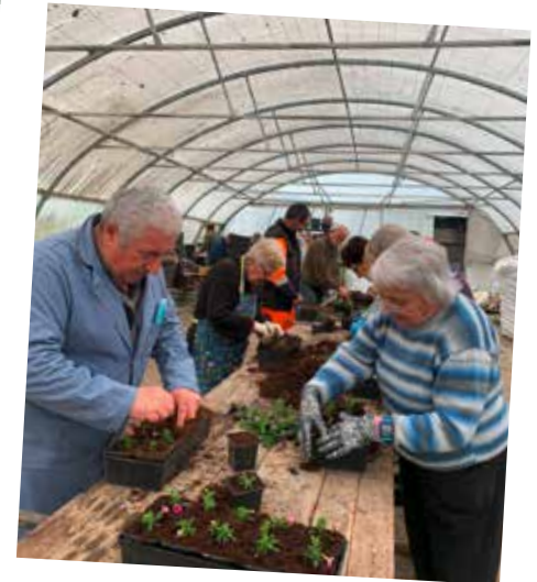
Ateliers repotage avec nos aînés