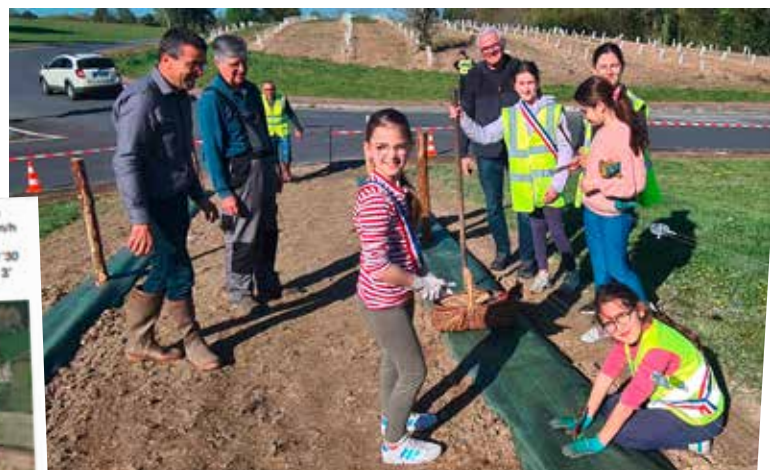
Des jeunes élus impliqués