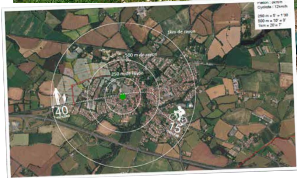
Une commune à portée de piéton