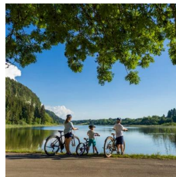
Jurassic Vélo Tour

Après de nombreuses opérations d'information et de sensibilisation sur l'éco-rénovation et l'écoconstruction, LEADER 2014-2022 a permis de soutenir financièrement des projets exemplaires comme la rénovation du centre social de Viry ou la construction du groupe scolaire de Bois d'Amont, mettant en valeur les éco-matériaux et le bois local.