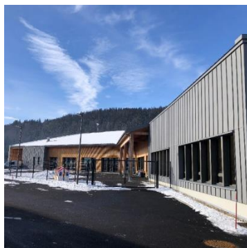
Groupe scolaire de Bois d'Amont

Actuellement à ses prémices, LEADER 2023-2027 ne bénéficie pas encore d'aperçu de réalisation mais les exemples du programme précédent sont parlants. Ils viennent pour certains clôturer un cycle de travail comme celui des éco-constructions et rénovations tandis que d'autres nécessitent d'être consolidés et confortés grâce au LEADER 2023-2027.