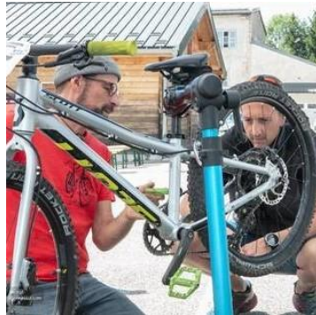
Atelier apprendre à réparer son vélo

Les Centrales Villageoises associent citoyens, collectivités, entreprises et associations du territoire. Elles ont déjà installé 6 toitures photovoltaïques sur le Haut-Jura et elles présenteront un kit d'autoconsommation photovoltaïque pour les particuliers à l'occasion des Rendez-vous en fête du Parc.