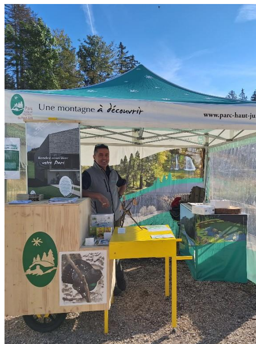
Stand du Parc avec son nouveau module d'accueil du public

Le samedi 2 septembre, le Parc a tenu un stand au Col de la Faucille à l'occasion de l'anniversaire d'un de ses partenaires, la Réserve de la Haute-Chaîne. Le Parc a également organisé 2 sorties accompagnées au départ de la manifestation pour parler des espaces protégés mais aussi des différences entre un Parc naturel régional et une Réserve. La manifestation a pu compter sur la présence de 3 bénéficiaires de la marque Valeurs Parc : Jérôme Gagneur apiculteur de la Ruche aux Papilles, Gildas Bodet artisan muretier et le Syndicat du Bleu de Gex Haut-Jura.