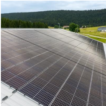
Panneaux solaires des centrales villageoises sur le toit du gymnase de Morbier

fête du Parc" est d'ailleurs une belle occasion pour en parler. Plusieurs conférences et ateliers seront donc organisés à la Maison du Parc à Lajoux le samedi 16 septembre prochain.