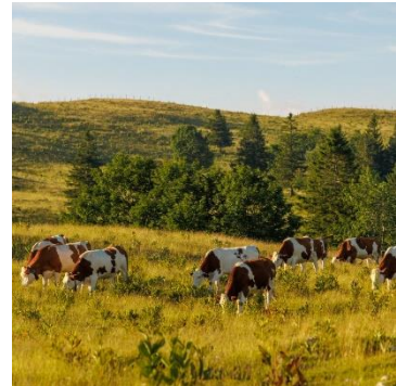
Alpage du Mont d'Or

Lors des RDV en fête, venez apprendre à réparer votre vélo avec la Biclouterie jurassienne. Une roue à assistance électrique sera également en démonstration pour transformer un vélo « musculaire » en un vélo à assistance électrique. A découvrir également, la voiture électrique du Parc en autopartage !