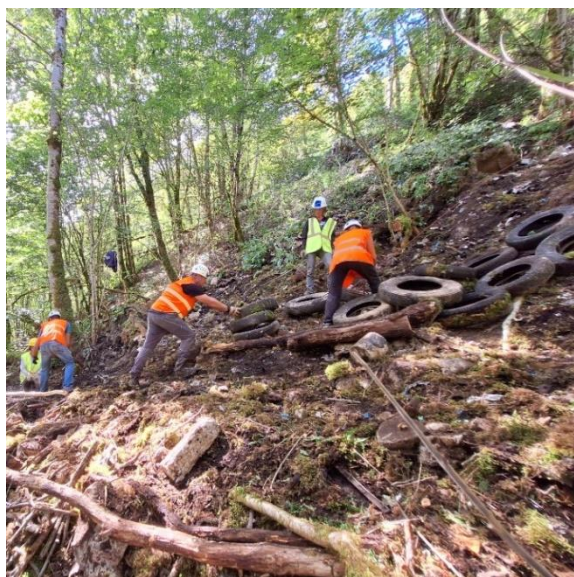
Environ 400 pneus ont été remontés et évacués de la décharge