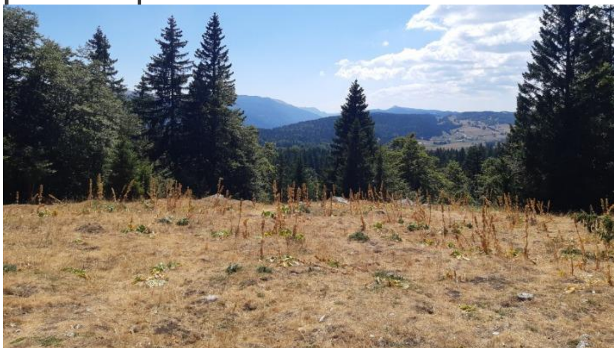
Crêt de la vigoureuse en période de sécheresse

Malgré une météo perçue comme maussade dans le Haut-Jura, les signes de changement climatique ont été visibles tout l'été. Passé le 15 du mois, le mois d'août a été marqué par une canicule exceptionnelle. Les alertes « sécheresses » se sont encore multipliées. Les attaques de scolytes touchent maintenant les épicéas d'altitude affaiblis par les sécheresses et les vents violents. Et à l'échelle mondiale, le mois de juillet 2023 a été le mois le plus chaud jamais enregistré sur Terre.