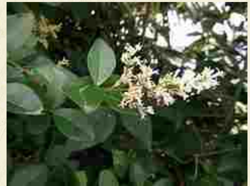
Fleurs de troène commun ( Ligustrum vulgare )