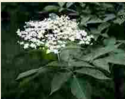
Inflorescence du sureau ou grand sureau ( Sambucus nigra )