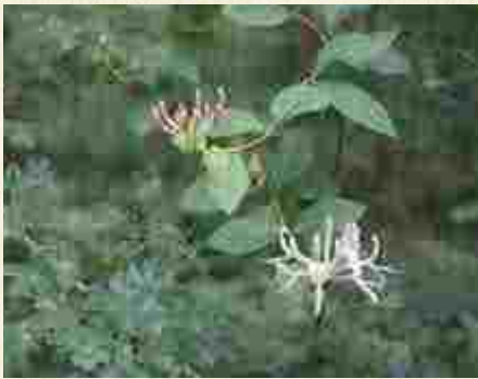
Fleurs de chèvrefeuille des bois ( Lonicera periclymenum )