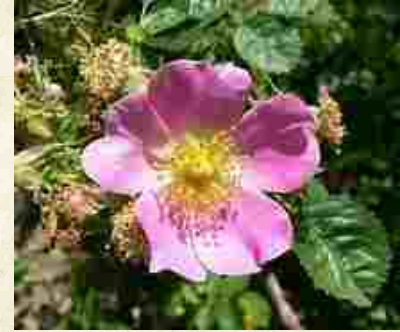
Fleur d'églantier, rosier des chiens ou rosier des haies ( Rosa canina )