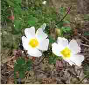
Fleurs de cistes de Montpellier ( Cistus monspeliensis )