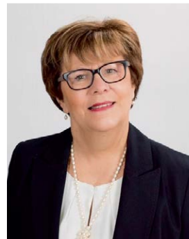
CHRISTINE GARNIER Maire de Quincy-sous-Sénart