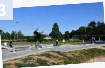
Mai 2021 - Aménagement d'une aire de glisse à Tournus (stade Noël Perret)