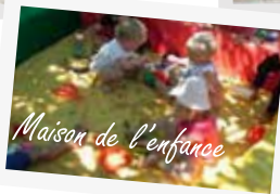
Maison de l'enfance