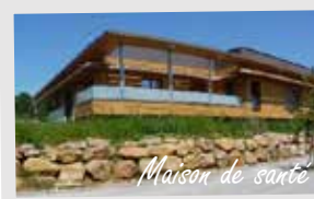
Maison de santé