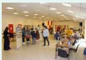
Visite de l'exposition