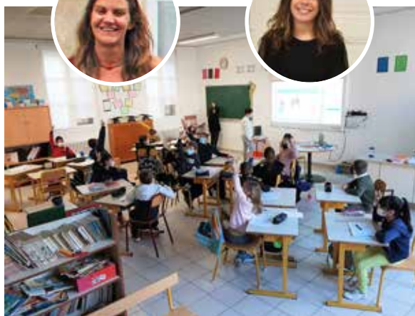
« Classe CE2-CM »