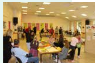
Exposition et ateliers