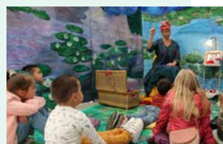
L'Art et la Manière de la Compagnie du 2ème K de figure