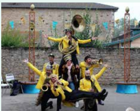
Spectacle Jûmêlag de l'Imperial Kikiristan