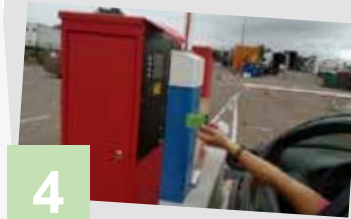
Depuis le 1 er janvier 2021 Mise en place du contrôle d'accès en déchèteries de Tournus et Péronne

+ d'infos : www.maconnais-tournugeois.fr