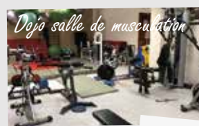
Dojo salle de musculation